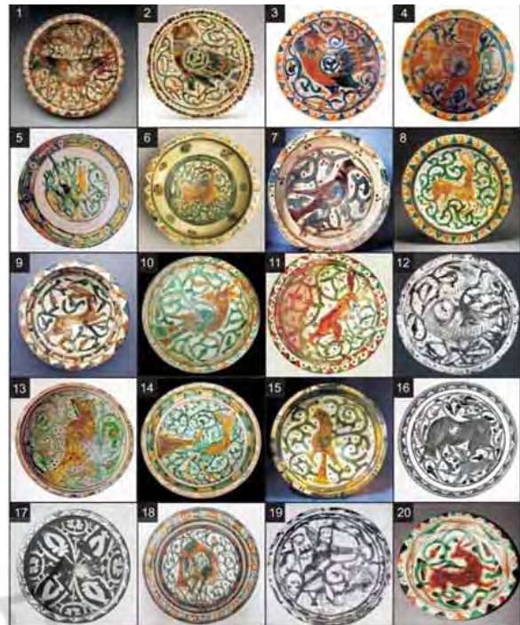
تصویر ۲: ۲۰ نمونه تصاویر رنگی منتخب از سفال نوع آقکند.