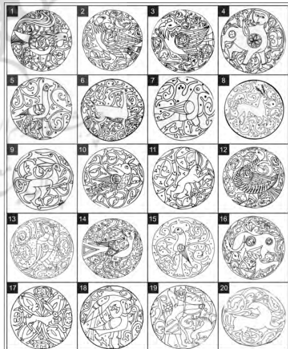
تصویر ۳: ۲۰ نمونه تصاویر خطی منتخب از سفال نوع آقکند.