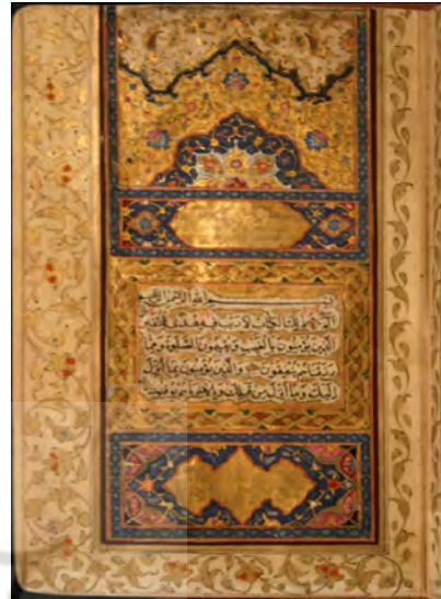
تصویر ۱: برگ دوم از صفحه افتتاحیه قرآن، ۱۱۲۴ هـ ق، ابعاد ۲۲ * ۳۶ سانتی متر، موزه ملی قرآن کریم

نوری است در طبیعت که از عالمی دیگر می تابد و حقیقت اشیاء و زیبایی ورای دنیوی آنها را آشکار می کند چون آینه که غیب نماند و گریزی به سوی عالم غیب فراهم می کند (تصویر ۱).