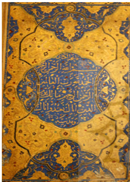
تصویر ۵: تزیینات صفحات افتتاحیه، قرآن اواخر دوره صفویه،

هنرمند مُدَّهَب در تلاش برای پدیدار ساختن انوار الهی درجسم رنگه‌است، رنگهای درخشان و پرتالوویی که جلوه‌گر گذر از چارچوب مادی شده‌است. لذا رنگ و نقش در تذهیب قرآن در عین گویایی پر از سکوت است، سکوتی که پیش از همه هنرمند تذهیب کار را به وادی حیرت می‌رساند تا قلمش تصویرگر علم نورانیت و غیب شود. رنگ طلایی بیشتر از خاصیت رنگ گونه بر تذهیب قرآن، تجلی نور و پیدایش همه هستی از درون وحدت است (همان: ۱۸) و بدین جهت مفاهیم عرفانی عمیقی را دنبال می‌کند. رنگ طلایی رنگی معنوی و فرامادی است که از پرتوهای معنویت و روحانیت، سالک به آن دست یافته است همچنین اشاره به خلوص و صداقت دارد.