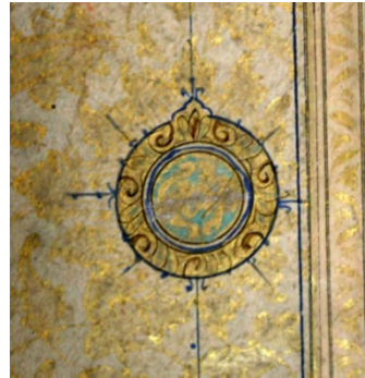
تصویر ۴: نشان صفحات، قرآن اواخر دوره صفویه، ۱۶۸*۲۶۳ میلیمتر،

رنگ زر نماد انسان کامل، عاشق و سالک است که از کیمیای عشق، زردروی و وجودش تبدیل به طلای ناب شده به این معنا که به حقیقت دست یافته است. نمونه این رنگ در تصویر دیگر از نسخه قرآنی دوره صفویه مشاهده می‌شود.