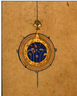
تصویر ۳: نشان صفحات، قرآن پایان قرن دهم هجری، ۱۷۲*۲۷۸ میلیمتر،

از میان نقوش هندسی تذهیب نقوشی که دارای ستاره یا شمسه است بیشتر تداعی کننده آسمان است،