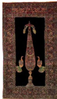
تصویر ۶- نقش سرو و طاووس و قرقاول در دو طرف به صورت متقارن. (۱۲۷۹ شمسی). به سفارش شهاب السلطنه بختیاری، موجود در موزه فرش ایران.