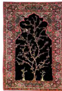
تصویر ۱۴- دو سرو، متقارن و به صورت زوج آمده است (۱۲۹۵ شمسی). به سفارش آقای دیلمقانی.