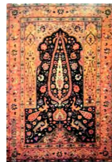
تصویر ۴- درخت سرو در مرکز و جانوران اساطیری در دو طرف درخت به صورت متقارن کار شده است (بین سال‌های ۱۲۹۰-۱۳۰۰ شمسی).

نمونه دوم قالی، متعلق به قالی‌های درختی - سروی است (تصویر ۵). همان‌طور که در تصویر مذکور قابل مشاهده است، ساختار کلی، مشابه نمونه قبل است. سرو با پایه گلدانی به عنوان نقش‌مایه اصلی در مرکز، پرندگان در اطراف و فرم محراب در بالای کار دیده می‌شود. همان‌طور که در تصویر ۶ دیده می‌شود، فرم سرو با چهار پرنده، شامل دو طاووس بزرگ متقارن در پایین کار و دو پرنده شبیه قرقاول که در بالای سرو کار شده، قابل مشاهده است. تفاوت فضاسازی داخلی این سرو با نمونه قبلی، به وضوح آشکار است. بیرون سرو با نوار باریکی پر از زنجیره گل و داخل آن به وسیله بنه‌جقه‌های متقارن