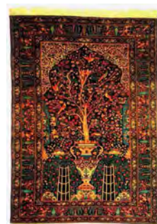
تصویر ۱۷- قالی درختی-آزاد گلدانی محرابی کرمان در دوره پهلوی دوم (شعبانی خطیبی، ۱۳۸۷، ۳۰۵)

تفاوت دارد. این نگاه را در نمایش گلدان، سبدهای گل در طرفین و پایه‌های آن‌ها، سبدهای میوه و ساختار خود درخت می‌توان دید. درخت در شکل کاملاً طبیعی طراحی شده، با شاخه‌هایی که کمترین انترزاع در آن‌ها صورت گرفته و نیمه بالای کار را پُر کرده‌است. با وجود رئالیسم موجود در اثر، شیوه فضا سازی همچنان وفادار به سبک کرمان است. همان‌طور که در تصویر ۱۸ دیده می‌شود، دو درخت سرو به شکل نیمه در پایین فرم محراب کار شده که درون آن‌ها توسط ستون‌های درشت گل‌وبرگ‌ها و غنچه‌های ریز اطرافشان پُر شده و تنه سروها از درون بوته برگی بیرون آمده‌است. درخت از گلدانی به فرم مثلث روئیده‌است که کاربری زمین را دارد. نقش پرند در لابه‌لای شاخه‌های درختان دیده می‌شود که با حرکت دایره‌وار در شاخه‌های کناری درخت، در حال پرواز یا به صورت نشسته هستند. در بعضی از طرح‌های کرمان و خصوصاً درختی‌ها شاهد وجود مار هستیم. فرم محراب مشابه نمونه قبل است؛ با این تفاوت که طرح داخل آن مستقل از زمینه طراحی شده و شامل یک گردش اسلیمی روی بند حلزونی است.