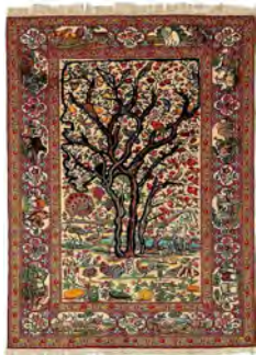
تصویر ۲۲- فرم درخت آزاد در قالی کرمان (۱۳۱۶ شمسی). به سفارش ابوالقاسم کرمانی.

در جدول زیر ویژگی‌های متفاوت درختی - سروی و درختی - آزاد را با هم مقایسه می‌کنیم: