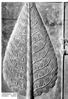
تصویر ۲- نقش درخت سرو در نقش‌برجسته کاخ آپادانا در دوره هخامنشی (دهه ۱۳۱۰ شمسی، توسط موسسه خاورشناسی دانشگاه شیکاگو).

نمادها در تاریخ ایران وجود دارد که بعد از آمدن اسلام، نه تنها کنار گذاشته نشده‌اند؛ بلکه گاه معنا و مفهوم مذهبی به خود گرفته و با تغییرات درخور آن دوره تاریخی و فرهنگ و مذهب، مورد استفاده قرار گرفته و مکرراً استفاده شده‌اند. نماد درخت یکی از نمادهای باستانی است که رنگ‌وبوی اسلامی به خود گرفته است.