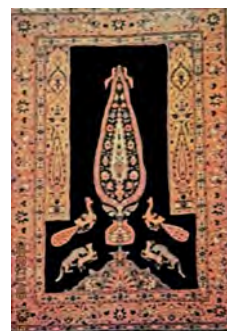
تصویر ۳- قالی درختی - سروی متقارن کرمان همراه با محراب متعلق به دوره اواخر قاجار

از محراب‌های رایج در طراحی قالی ایران است. به این شکل که به جای یک تکه کار شدن، به صورت سه تکه کار شده است. بنا بر تحقیقات صورت گرفته، این گونه طرح‌های سروی، برگرفته از پارچه‌های قلمکار است که بعدها و بعد از ظهور این تصاویر در کتب چاپی اولیه و عکس‌های اواخر قاجار، توسط طراحان قالی ایران و خصوصاً کرمان مورد تقلید قرار گرفت (ژوله، ۱۳۸۴: ۱۷؛ پرهام، ۱۳۶۴: ۳۳۰).