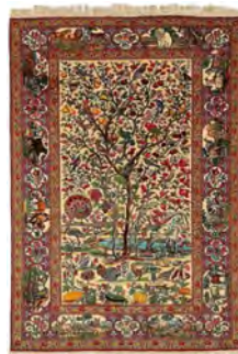
تصویر ۲۱- قالی درختی آزاد کرمان در دوره پهلوی اول (www.teppteamusa.com)

مانند نمونه‌های قبل، به صورت رئالیسم طراحی شده است. یکی از ویژگی‌های مشترک بین پنج نمونه درختی‌های آزاد، اندازه تنه درخت است که معمولاً باریک و کم‌ضخامت طراحی شده است. شاخه‌های رها، آزاد و رقصان، متن بالای تصویر را پُر کرده است. بر خلاف درختی - سروها، این نمونه نیز مانند تصویر ۱۵ فاقد محراب است و معمولاً الزامی برای حضور فرم محراب در درختی‌های آزاد وجود ندارد. در این قالی، حضور فعال انواع پرندگان دیده می‌شود که کمیاب‌ترین آن یعنی طاووس، بوقلمون، طوطی و... در فضای متن خودنمایی می‌کند.