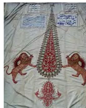
تصویر ۱- نمونه‌ای از خیمه عزاداری امام حسین (ع) در دوره پهلوی دوم در کرمان که تصویر درخت زندگی (سرو) با دو شیر محافظ را نشان می‌دهد (عکاس: آلبوم شخصی محمدجواد یعقوبی، ۱۳۹۰)

۱۳۸۱: ۴۹). می‌توان گفت که والاترین درخت در قرآن، درخت سدره یا درخت طوباست که در بهشت جای دارد (توماچ‌نیا و طاووسی، ۱۳۸۵: ۱۵). نکته قابل ذکر وجه نمادین این درخت در اسطوره‌ها با گرفتن رنگ‌مایه مذهبی، اشاره به جاودانگی و حیات پس از مرگ است، که این ویژگی در نشانیدن درخت سرو بر روی مقابر است که جنبه تقدس آن، بعد از اسلام به صورت سمبولیک انجام شده است. با این تفکر در اسلام، درخت سرو را درخت طوبا می‌نامند. همان‌طور که در تصویر شماره ۱ دیده می‌شود، در مراسم آیینی و مذهبی در ایران، مانند عزاداری عاشورا، بر روی تمامی علم‌ها و خیمه‌ها به‌طور سمبولیک از نقش سرو مقدس، استفاده شده است (باقری، ۱۳۸۹: ۱۰۹).