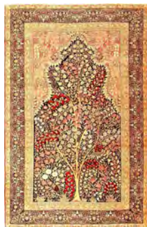
تصویر ۱۹- قالی درختی آزاد کرمان یا درخت زندگی، متعلق به دوره قاجار (www.Nazmiyalantiquerugs.com)

تصویر ۱۹ نمونه نهم قالی، از زیباترین درختی‌های آزاد کرمان را نشان می‌دهد. این نمونه بسیار شبیه به تصویر ۱۳ است. در این نمونه، یک درخت سراسری و نامتقارن در مرکز قالی طراحی شده‌است (تصویر ۲۰). درخت با شاخه‌های رها و آزاد، از پایین تصویر تا نزدیک محراب بالا آمده‌است. شاخه‌های پُر از گل‌های متنوع به صورت فشرده و کنار هم، فضای اطراف درخت را پُر کرده‌است. فرم این درخت نزدیک به درختی‌های موجود در طبیعت طراحی شده که ویژگی شاخص این گونه درختی‌هاست. در این نمونه، محراب هم وجود دارد و فضای داخلی آن، از خوشه‌های گل به هم چسبیده تشکیل شده‌است. در این نمونه برخلاف تصویر ۱۳، پرندگان متنوع و زیادی حضور ندارند و نقش اصلی را درخت آزاد و گل‌های متنوع پُر کرده‌است.