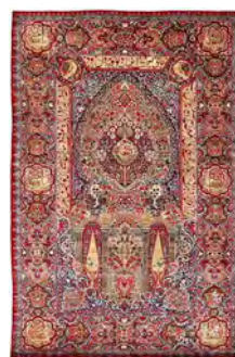
تصویر ۹- قالی درختی- سروی کرمان، متعلق به اوآخردوره قاجاریه (www.Ruglibrary.com)