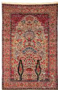
تصویر ۱۱- قالی درختی- سروی کرمان متعلق به اواخر دوره قاجاریه

به هم فشرده پُر شده که شیوه شاخص طراحی کرمان است.