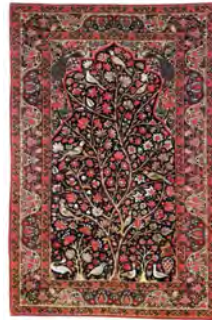
تصویر ۱۳- قالی درختی- سروی کرمان متعلق به اواخر دوره قاجاریه (www.Ruglibrary.com)

این‌گونه درختی‌ها تقریباً در تمام مناطق ایران کار می‌شود. یکی دیگر از عناصر مهم تزیینی این نمونه، پرندگان متعدد و متنوعی است که حضور برجسته‌ای در طرح دارند. محراب طرح با ترکیب منحنی‌ها و شکست‌ها شکل گرفته است. دو طاووس بزرگ نیز به صورت قرینه در فضای بالای محراب قرار گرفته‌اند. همان‌طور که دیده می‌شود،