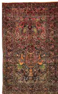
تصویر ۵- قالی درختی - سروی کرمان با تأثیراتی از پارچه‌های قلمکار در دوره قاجار. (www.liveauctioneers.com)

فرم گلدانی پایه نیز کاملاً قابل مقایسه با نمونه قبل است که در اینجا با تزیینات بیشتر کار شده است. محراب با قوس‌هایی بزرگ و با عناصر زیاد، به تصویر درآمده و درون آن، با گردش ختایی با گل‌های ریز و بنه‌جقه‌های سه‌گانه به هم چسبیده، پُر شده است. در اطراف سرو در زمینه، همان‌طور که مشاهده می‌شود از دو گردش متقارن ختایی به شیوه گردش‌های حلزونی برای پُر کردن فضا استفاده شده است؛ با همان ویژگی فضاسازی کرمان؛ یعنی تقریباً هیچ گلی روی بند قرار نمی‌گیرد؛ بلکه از آن منشعب شده، و فضای میانی گردش‌های حلزونی را پُر می‌کند و خود بند اصلی، خالی از هر گونه عنصری است. همان‌طور که مشاهده می‌شود حاشیه طرح کاملاً خاص و متفاوت و به شکل تقریباً سراسری کار شده است و خبری از واگیره‌بندی نیست. خطوط جداکننده حاشیه‌های باریک در گوشه‌های کار، با رد شدن از روی هم، چهار قاب مربع‌شکل را به وجود آورده‌اند. این شیوه حاشیه‌سازی، شیوه مرسوم پارچه‌های قلمکار قدیمی است که اینجا در قالی کرمان ظاهر شده است.