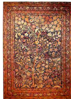
تصویر ۱۵- قالی درختی- سروی کرمان متعلق به اواخر دوره قاجاریه