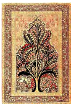
تصویر ۲۰- درخت رقصان نزدیک به فرم درختی‌های طبیعت (در حدود ۱۲۵۹ شمسی)

دهمین نمونه و آخرین قالی از نوع درختی‌های آزاد کرمان، در تصویر ۲۱ مشاهده می‌شود. این قالی یکی از قدیمی‌ترین و جزو قالی‌های درختی آنتیک کرمان است. همان‌طور که در تصویر ۲۲ مشاهده می‌شود، یک درخت اصلی و دو درخت فرعی در اطراف درخت اصلی طراحی شده‌است. فرم درخت