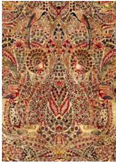
تصویر ۷- قالی درختی- سروی کرمان متعلق به اوخردوره قاجاریه (www.hadimaktabi.com)