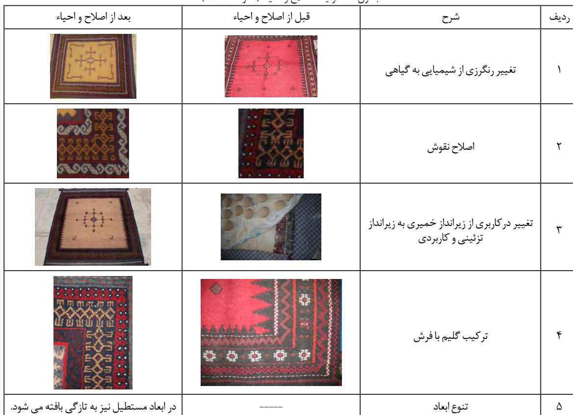
جدول ۳ - فرآیند اصلاح و احیاء (نگارنده، ۱۳۹۳)

یکی از عمده مشکلات جوانان روستایی، عدم برخورداری از شغل و درآمدی ثابت می‌باشد که این امر باعث مهاجرت بسیاری از روستائیان به شهرهای کوچک و بزرگ گردیده