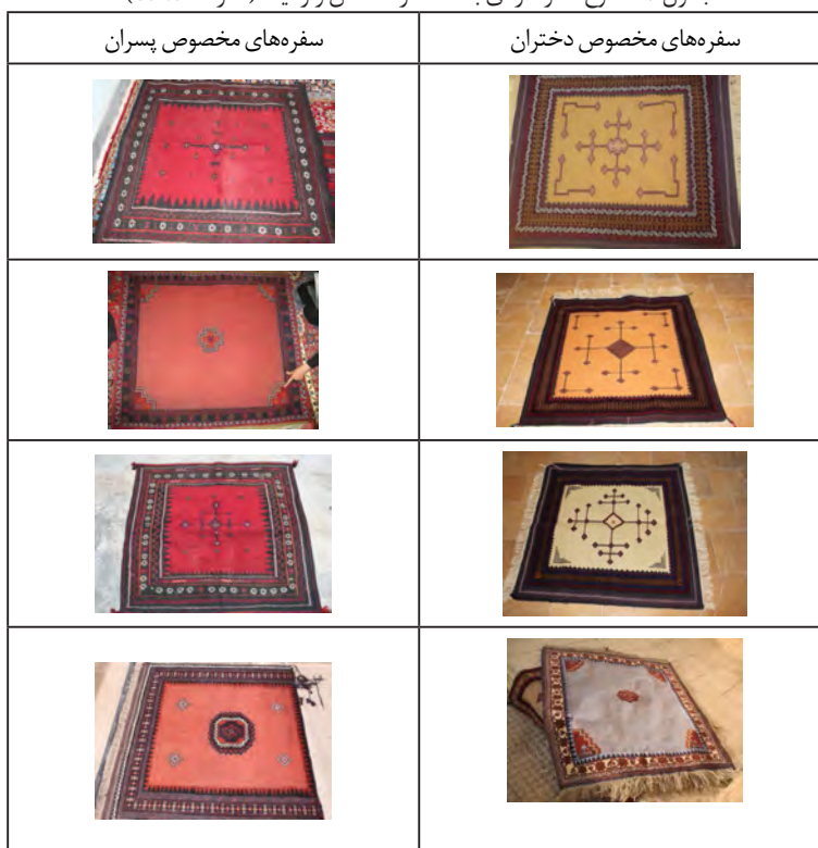
جدول ۲ - تنوع سفره آردی به لحاظ رنگ متن و زمینه (نگارنده، ۱۳۹۳)