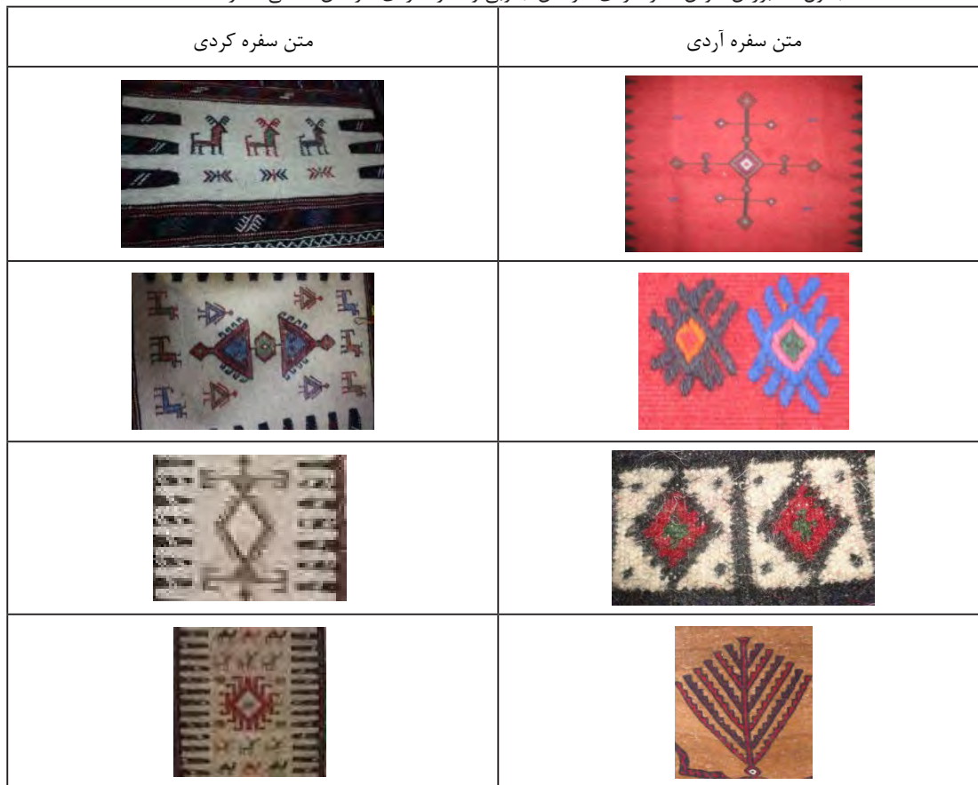
جدول ۴- بررسی نقوش سفره آردی خراسان جنوبی و سفره کردی خراسان شمالی (نگارنده، ۱۳۹۳)

یکی از عناصر اصلی و مهم سفره‌های کردی نقش‌مایه انگشت یا بیچک است که در کناره‌های طولی قالی بافته می‌شود، برخی از تولیدکنندگان فرش کردی این انگشت‌ها را نماد وحدت یا شب و روز می‌دانند، یا می‌تواند