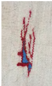
تصویر ۶- نقش چشم کبکی (نگارنده، ۱۳۹۳)