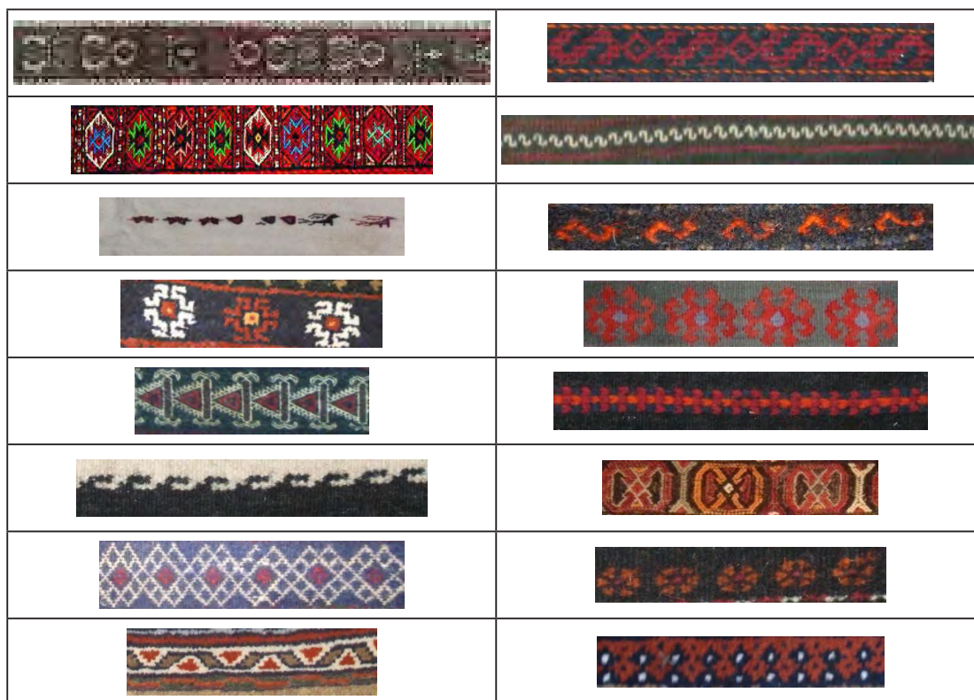
جدول ۵ - بررسی تشابهات در سفرآردی خراسان جنوبی و سفره بافی خراسان شمالی (نگارنده، ۱۳۹۳).