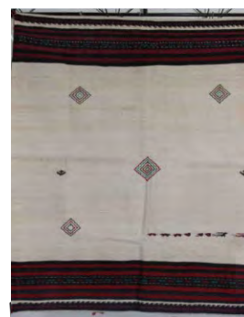
تصویر ۲- سفره ساده (نگارنده، ۱۳۹۳)

این بافته اصیل در ابعاد مربع یا مستطیل بوده و در گذشته زیر تغار یا ظرفی که آرد در آن خمیر می‌شود قرار گرفته تا هنگام تهیه خمیر و ورز دادن آن از ریخت و پاش جلوگیری شود. پس از تهیه خمیر و تا زمان ورآمدن و ترش شدن گوشه‌های سفره را بر روی ظرف تا زده تا گرمای خمیر حفظ شده و زودتر ورآید. در زمان چانه کردن خمیر نیز چانه‌ها و یا گرده‌های خمیر بر روی سفره که قبلاً سطح آن را به آرد آغشته کرده‌اند قرار داده و سپس گرده‌ها را برای تخت نمودن و پختن نان استفاده می‌کنند. بعد از آماده شدن نان در تنور، نان پخته شده را بر روی سفره قرار داده تا خنک شود و سپس چهار گوشه سفره را بر روی نان کشیده تا از خشک شدن آن جلوگیری گردد. با این توضیح سفره‌های مورد استفاده در عمل طبخ نان به اشکال و ابعاد و تزیینات مختلف تقسیم می‌شوند. معمولاً سفره‌هایی که در تهیه‌ی خمیر و گرده کاربرد دارند ساده‌تر و کم‌نقش‌تر و ابعاد بزرگتر بوده و تکنیک بافت آن‌ها اغلب گلیمی بوده و از جنس پنبه می‌باشند. نقوش در این دست‌بافته اغلب در دو سمت بالا و پایین به کار می‌رفته و در قسمت متن اکثراً بدون نقش و یا دارای نقوش بسیار ساده و زمینه متن به رنگ سفید بوده است (تصویر ۲).