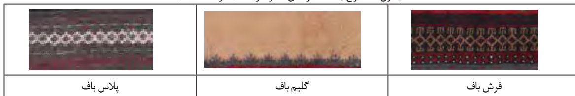
جدول ۱ - انواع بافت‌ها در متن سفره آورده‌ها (نگارنده، ۱۳۹۳)

و سفید متمایل به کرم در بافت سفره آردی غالب می‌باشد که هر کدام دارای معنی و مفهوم خاص خود می‌باشد. این دست‌بافته از گذشته تاکنون به عنوان یکی از اقلام مهم جهیزیه‌ی دختران روستا و مناطق