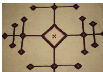
تصویر ۳- نماد خورشید در متن سفره آردی (نگارنده، ۱۳۹۳)

هر نقش آمیزه‌ایی از فرم‌ها و رنگ‌هاست که متأثر از طبیعت و باورهای نشأت گرفته از فرهنگ جامعه‌هایی است که به آن تعلق دارد و همچنین متأثر از اساطیر کهن و یا آداب و رسوم و اعتقادات گذشتگان است که با تکنیک‌های بافت و اجرای اثر که سینه به سینه از والدینش به او آموخته شده، گنجینه‌ای از موارث معنوی و نقوش تجریدی و انتزاعی و سمبلیک بر بافته‌هایش نقش می‌بندد. در بررسی میدانی و مشاهده عینی نقوش سفره‌های منطقه اغلب در دو زمینه (متن و حاشیه) تقسیم‌بندی گردیده‌اند. متن، نماد کویر و دشت که اغلب بدون نقش یا همراه با نماد صلیب در مرکز آن می‌باشد که نمادی از خورشید (تصویر ۳) بوده و به عنوان مهمترین عنصر در سرزمین کویری خراسان جنوبی دارای اهمیت بسزایی است و حاشیه که در اغلب موارد دارای طرح زنجیره‌ای می‌باشد به عنوان حصار کوهستانی این منطقه کویری بوده و در سفره‌های قدیمی‌تر به عنوان تنها ترین نقش تزیینی دورتا دور سفره‌ها را محصور نموده (تصویر ۴) و در حال حاضر نیز جزء داخلی‌ترین بخش حاشیه و هم‌جوار با متن استفاده می‌شود (حمزه و همکاران، ۱۳۹۴: ۱۶).