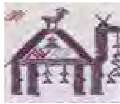
تصویر ۸- نقش شتر در سفره کردی

بیان‌کننده دست‌های مهمانی‌هایی باشد که در یک جشن دورتادور سفره‌ی صاحب مجلس جمع شده‌اند. همچنین می‌توان گفت این نقش‌مایه الگویی از دستان افراد خانواده است که روز و شب در کنار هم کار و تلاش می‌کنند و در هنگام صرف غذا دور این سفره جمع می‌شوند (تصویر ۱۰). لازم به ذکر است که نقوشی که در سفره‌های کردی شمال خراسان بکار می‌روند قندهی خاصی ندارد و بافنده بر اساس ذوق و سلیقه‌ی شخصی تغییرات زیادی در نقوش اصلی ایجاد می‌کند.