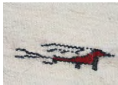
تصویر ۵- نقش چشم کبکی (نگارنده، ۱۳۹۳)

شاخصه‌ی تأثیرگذار دیگر بر نوع نقوش سفره آردی‌ها، اقلیم و طبیعت شهرستان قاینات می‌باشد. در این شهرستان تنوع اقلیم و طبیعت از آب و هوای سرد و خشک کوهستانی گرفته تا گرمای طاقت فرسای کویر، باعث بوجود آمدن پوشش‌های گیاهی متنوع و به دنبال آن زیستگاه مناسبی برای حیواناتی چون شتر، کبک، گنجشک، گربه وحشی، مار و عقرب، بز و ... به وجود آمده است. «هنگامی که به حافظه و زندگی ایرانیان در طول تاریخ نگاه می‌کنیم همواره شاهد حضور گیاهان، درختان و انواع باغ‌ها در مکان‌های زندگی ایشان هستیم تمایل به سرسبزی علاوه زندگی، در هنر قالی بافی ایرانیان نیز حضور دارد» (افروغ، ۱۳۹۰: ۱۱). این در مورد نقوش سفره‌بافی قاینات بر