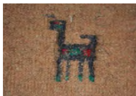
تصویر ۷- نقش بز