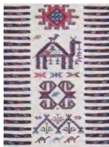
تصویر ۱۰- نقش انگشتی در حاشیه سفره کردی

یکی از عناصر اصلی و مهم سفره‌های کردی نقش‌مایه انگشت یا بیچک است که در کناره‌های طولی قالی بافته می‌شود، برخی از تولیدکنندگان فرش کردی این انگشت‌ها را نماد وحدت یا شب و روز می‌دانند، یا می‌تواند