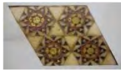
تصویر ۳. خاتم توگلو مروارید

خوانده شده است. همچنین خاتم "توگلو مروارید" (تصویر شماره ۳) به لحاظ استفاده استخوان یکپارچه در قسمت توگلوئی آن به این نام خوانده شده است. در صفحه ۸۷ مقاله نویسنده اسامی خاتم‌ها را اغلب مربوط به صورت نهایی یا براساس مواد مصرف شده در ساخت آن‌ها دانسته که در مثال نیز تفاوت‌های میان این دو را چندان واضح و مستدل بررسی نکرده است. به طوری که دلیل نام گذاری خاتم "جویی" (Joeyi) را براساس مواد اولیه و نام گذاری خاتم "طاقی" را براساس صورت نهایی (شکل بصری) دانسته است.