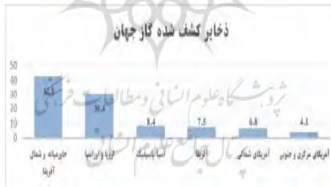
نمودار ۲ ذخایر کشف شده گاز جهان

به‌ویژه ماهی و میگو (مشروط به کنترل آلودگی نفتی خلیج فارس) می‌باشد. (قنبری جهرمی، ۲۰۶:۱۳۹۴).