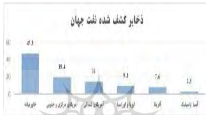
نمودار ۱ نمودار شماره ۱: ذخایر کشف شده نفت جهان (منبع BP Statistical Review of World Energy, 2017)

خلیج فارس قرار دارند. از این رو شایسته است که کشورهای حاشیه خلیج فارس که دارای میدان‌های گازی مشترک می‌باشند (ایران، قطر و عربستان) با نظم بخشیدن به برداشت خود از این میادین زمینه‌های رقابت را از بین ببرند و دامنه همکاری‌ها را گسترش دهند (کامران و همکاران، ۸۰:۱۳۹۰). عربستان سعودی به دنبال آسیب رساندن به