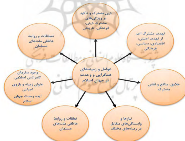
شکل ۲. عوامل همگرایی میان کشورهای اسلامی (پژوهشهای جغرافیایی جهان اسلام، ۱۳۹۱: ۱۴۲)

اقتصادی، اجتماعی، دفاعی و نظامی، سیاسی و فرهنگی است. از عوامل اصلی همگرایی در جهان اسلام عامل دیانت مشترک اسلامی است. وجود جمعیت قابل ملاحظه مسلمان، تلاش برای وحدت اسلامی و ایجاد امت اسلامی بستر اصلی شکل‌گیری همکاری اسلامی به‌طور رسمی (سازمان همکاری اسلامی) یا غیر رسمی است. اندیشه وحدت‌گرایی، که نقطه تأکید کشورهای اسلامی و همکاریهای رسمی اسلامی در قالب سازمان و ... است به‌علت منافع و دیدگاه‌های متفاوت کشورها کنار گذاشته می‌شود و حرکت‌های جمعی مشترک به منافع خاص کشوری تغییر مسیر می‌دهد و باعث واگرایی می‌شود. از عوامل مؤثر در واگرایی همکاریهای اسلامی تفاسیر و قرائت‌های متفاوت و متعارض از اسلام و تأکید بر حقانیت خود و تلاش برای حذف دیگران، تأمین حقوق اقلیتهای مذهبی اعم از شیعه یا سنی، اختلافات مرزی، چگونگی و میزان تقابل یا تعامل و همسویی با غرب، نبود سیاست‌های اقتصادی و تجاری مشترک، نبود ضمانت اجرایی برای مصوبات سازمان، تفاوت نظر در برابر فلسطین و ساختار مبارزه با رژیم صهیونیستی، تفاوت مواضع در مورد بیداری اسلامی، آینده جهان اسلام، و ... است (نظرآهاری، ۱۳۷۶: ۷۳۵).