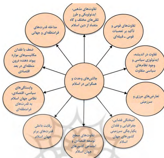
شکل ۳. عوامل واگرایی میان کشورهای اسلامی (پژوهشهای جغرافیایی جهان اسلام، ۱۳۹۱: ۱۴۳)