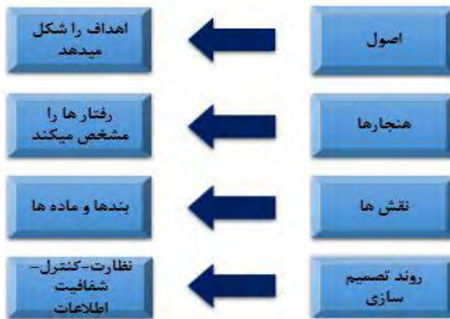
شکل ۱. چارچوب رژیم‌های بین‌المللی

یکی از مهم‌ترین اهداف اعمال رژیم‌ها، مقوله «حکمرانی جهانی» است. «حکمرانی جهانی خواستار تغییر موقعیت قدرت درزمینه تلفیق و چندپارگی است. روزنا، این روند را به‌عنوان یک گرایش فراگیر توصیف می‌کند، که در آن تغییرات عمده در موقعیت و وضعیت اقتدار و قدرت و مکان مکانیزم‌های کنترل در همه قاره‌ها صورت می‌گیرد. تغییراتی که در اقتصاد و سیستم اجتماعی به وقوع پیوسته به همان اندازه در سیستم سیاسی، آشکارند. روزنا حاکمیت جهانی را به‌عنوان «سیستم حکومت در تمامی سطوح» تعریف می‌کند- از خانواده تا سازمان بین‌المللی- که به‌واسطه آن اهدافی که از طریق اعمال کنترل تعقیب می‌شوند نتایج فراملی در پی دارد» (Weiss, 2000). یا کاکس حاکمیت جهانی را این‌گونه توصیف می‌کند که « روندها و رویه‌هایی که در سطح جهانی (یا منطقه‌ای) برای مدیریت امور سیاسی، اجتماعی و اقتصادی وجود دارند» (Thérien & Pouliot, 2017).