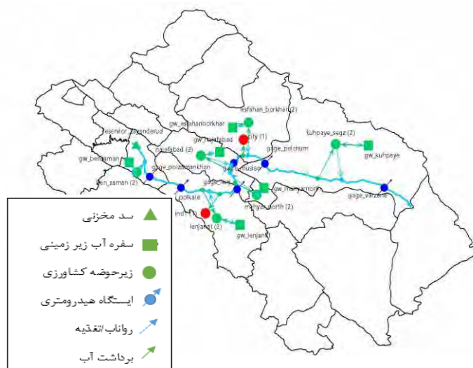
شکل ۱- شبکه گره‌ها و جریان‌های ورودی و خروجی محدوده مطالعاتی رودخانه زاینده‌رود در نرم افزار WEAP

تقاضاهای شاخه‌های پایه آن (BT) تعریف می‌شود. شاخه پایه، شاخه‌ای است که زیر آن شاخه‌ای وجود ندارد. معادلات ۱ تا ۹ روابط موجود در نرم افزار WEAP برای کاربرد پارامترها و محاسبه متغیرهای مورد نظر در بخش هیدرولوژیکی می‌باشند.