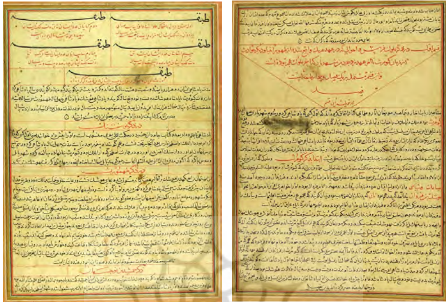
راست: تصویر ۱. برگ ۴ از جامع/التواریخ مورخ ۷۱۷ق/۱۳۱۴م که در دربار شاهرخ نوسازی شده است، کتابخانه کاخ توپکاپی (خزینة ۱۶۵۴)، (منبع: خریداری شده از کتابخانه کاخ توپکاپی) / چپ: تصویر ۲. برگ ۴ از همان نسخه (منبع: همان).