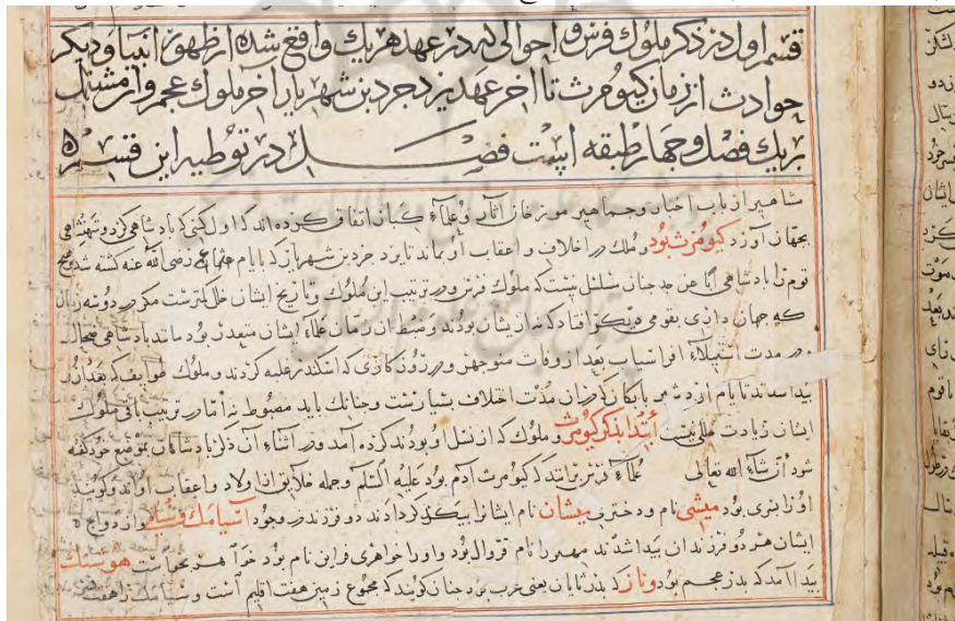
تصویر ۳: برگ ۵ از نسخه ای بدون تاریخ از جامع/التواریخ کتابت شده برای شاهرخ، کتابخانه بریتانیا (Ms. Add. 7628).