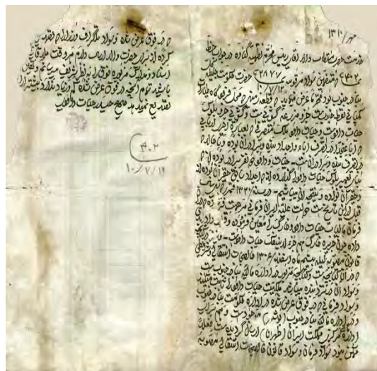
«سند شماره یک: نامه حیدرخان حیات داودی به تنظیمه گناوه در خصوص مالکیت و تاریخیچه بلوک حیات داود در تاریخ ۱۳۱۰/۰۷/۱۹»