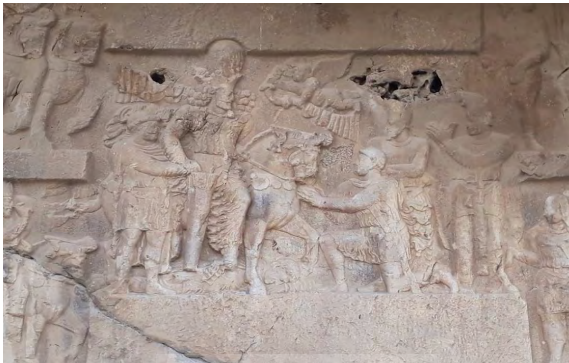
شکل ۹: نقش برجسته شماره ۲ در بیشاپور.