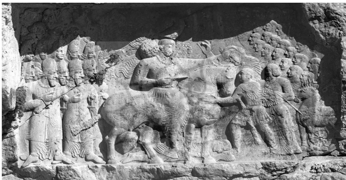
شکل ۷: نقش برجسته داراب: شاپور و سه امپراتور رومی (اقبال آشتیانی، ۱۳۸۸: ۲۸۶).