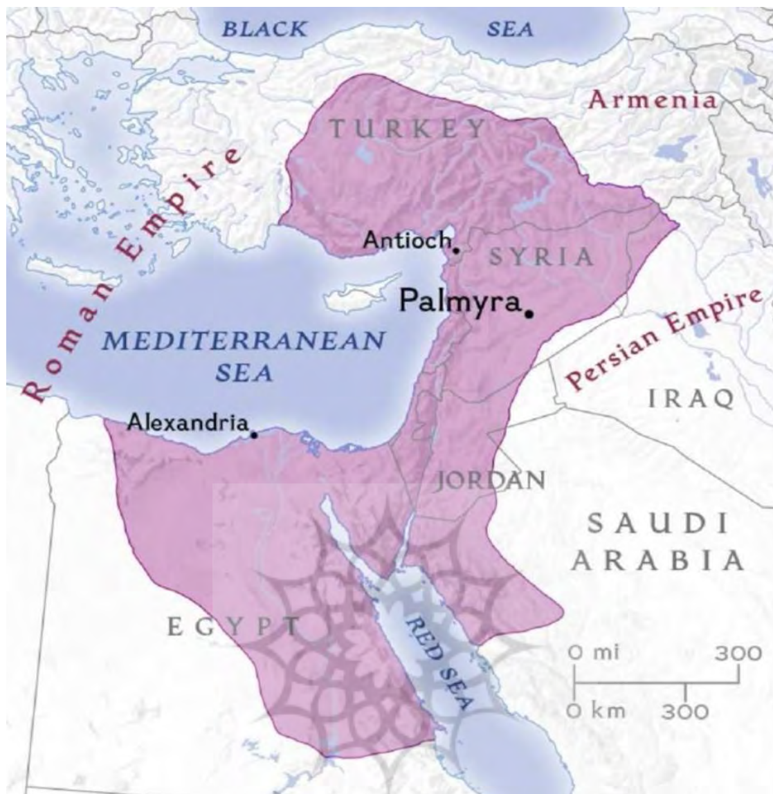
شکل ۱۵: وسعت قلمرو اودیناتوس و جانشینانش.

Ref. https://www.Politics-history.mozello.com/Palmyrans_Empire