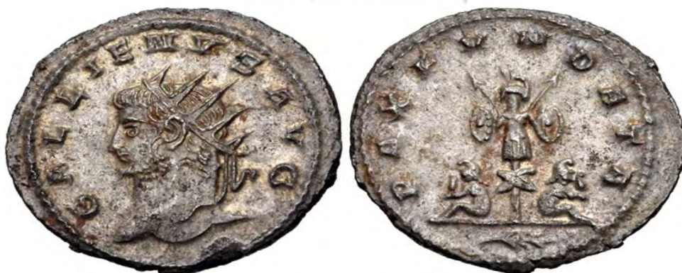
شکل ۱۲: سکه متعلق به اَدیناتوس که روی آن تصویر گالینوس و پشت آن به احتمال امیر پالمیری را نشان می‌دهد.