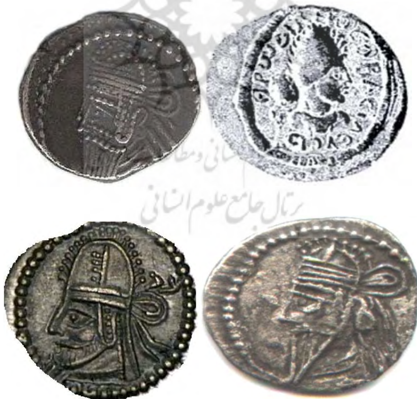
شکل ۱۴: بالا سمت راست هرودیانوس فرزند آدیناتوس که تاج اشکانی بر سر دارد و مقایسه شده است با سه سکه از خسرو دوم، بلاش پنجم و اردوان چهارم اشکانی.

Ref: www.Parthia.com/coins/Attribution correlation chart/Type 85, 88, 89