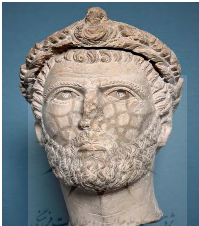
شکل ۱۱: سردیس منتسب به اَدیناتوس که اینک در موزه Ny Carlsberg Glyptotek نگهداری می‌شود.