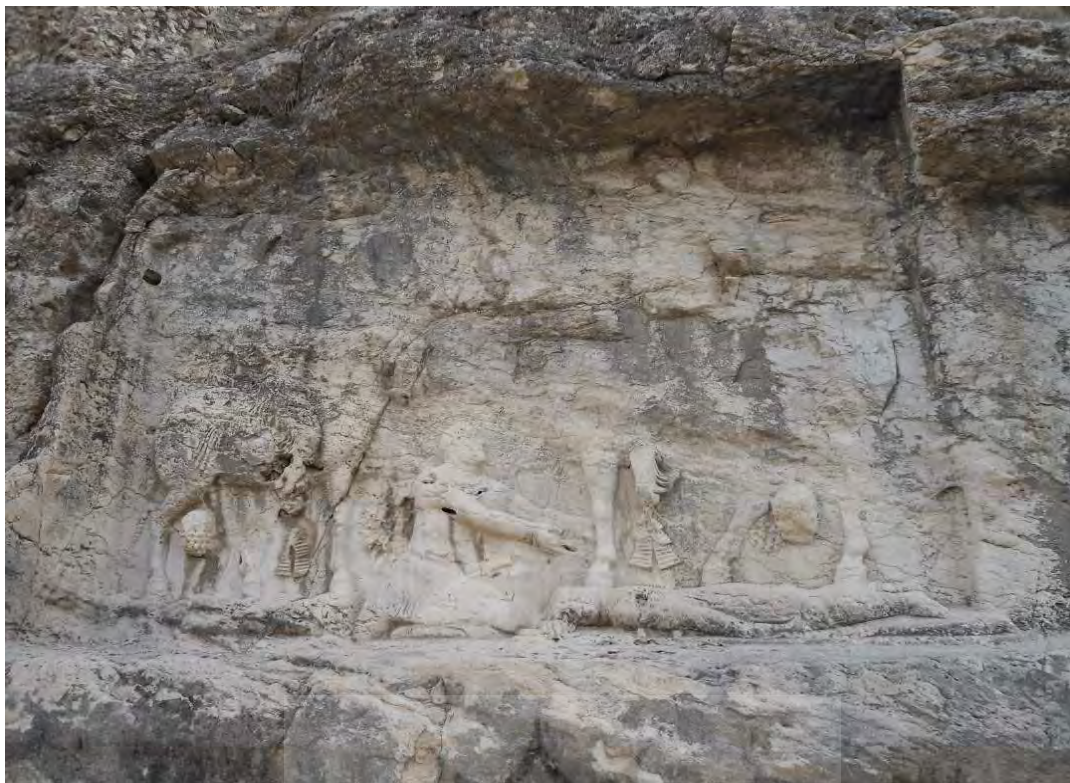
شکل ۱: سنگ‌نگاره شماره ۳ شاپور در تنگ چوگان بیشاپور.