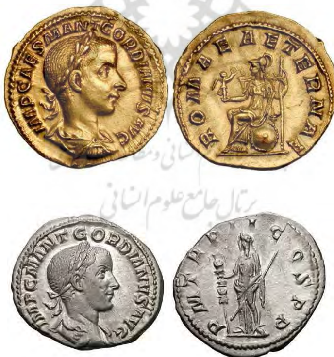
شکل ۲ و ۳: سکه‌های گوردیانوس سوم.

Ref: www.AncientRomanscoins.Com/Imperialcoins/theMiliarycrisis/GordianIII