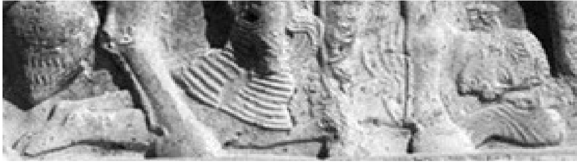
شکل ۱۰: مقایسه چهار نقش از گوردیانوس در داراب و تنگ‌چوگان.