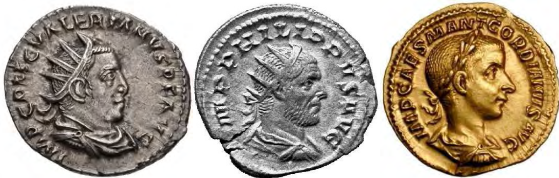
شکل ۴ و ۵: از راست به ترتیب: ۱. گوردیانوس سوم؛ ۲. فیلیپ عرب؛ ۳. والرین.

Ref: www.Ancient Romans coins.Com/Imperial coins/the Military crisis/Gordian III, Valerian II, Philippus