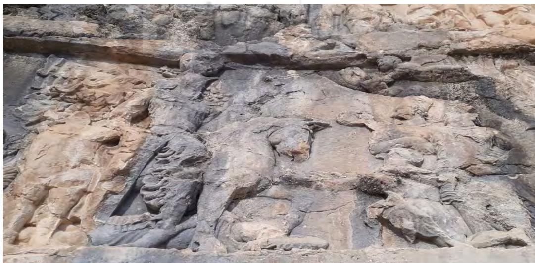
شکل ۸: نقش برجسته شماره ۱ شاپور در تنگ چوگان.