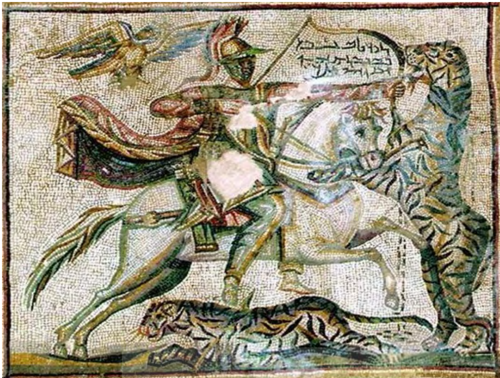
شکل ۱۳: موزائیکی که به احتمال به آدیناتوس سوار بر اسب مربوط است. (Andrade, 2018:139)