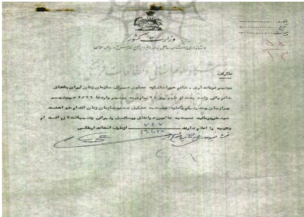
شماره ۲: تشکیل شعبه‌های سازمان زنان بوشهر توسط نمایندگان این سازمان.