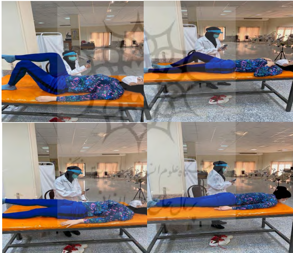
شکل ۱- آزمون‌های کنترل کمری-لگنی: الف، تست KLAT؛ ب، تست BKFO؛ ج، ASLR؛ د، تست PRONE

فشار پایه از پیش تعیین شده (۴۰ یا ۷۰ میلی‌متر جیوه) در حین هر آزمایش ثبت شد. چنان‌چه میانگین تغییرات فشار هر چهار آزمون برای هر فرد بیش‌تر از \pm ۸ میلی‌متر جیوه بود (فشار || ۸ \pm || انحراف از فشار پایه ۴۰ یا ۷۰ میلی‌متر جیوه)، به‌عنوان حرکات کنترل نشده کمری-لگنی و اختلال در نظر گرفته می‌شد. همچنین اگر میانگین تغییرات فشار چهار آزمون برای هر فرد کمتر از \pm ۸ میلی‌متر جیوه بود (فشار انحراف از فشار پایه ۴۰ یا ۷۰ میلی‌متر جیوه) به‌عنوان کنترل کمری-لگنی مطلوب در نظر گرفته شد. ضریب پایایی آزمون‌های کنترل کمری-لگنی (۰/۰-۸۶/۹۰) گزارش شده است (۱۷، ۱۵).