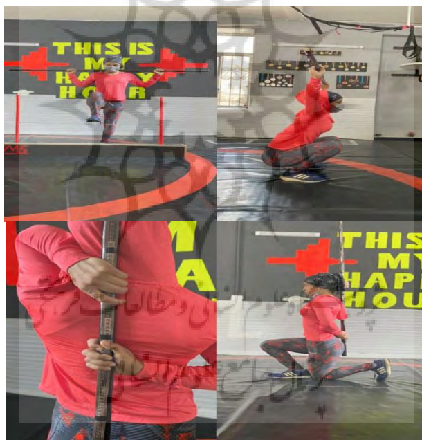
شکل ۲- نحوه اجرای آزمون غربالگری حرکتی عملکردی (FMS)

آزمون غربالگری عملکردی ۱ : این آزمون آزمونی عملکردی و ابزاری مشاهده‌ای برای گزارش احتمال آسیب در آینده به ورزشکار است و توسط کوک معرفی شده است (۲۲) (تصویر شماره ۲). تی هن ۲ و همکاران پایایی درون آزمونگر این ابزار را ۰/۶۳ تا ۰/۸۵ و بین آزمونگر را ۰/۶۰ تا ۰/۸۳ گزارش کرده‌اند که نشان‌دهنده پایایی خوب (۲۳) آن است. چوربا ۳ و همکاران روایی این آزمون را (۰/۵۸-۰/۷۴) گزارش کرده‌اند (۲۴). پژوهشگرانی که از امتیاز مرکب این آزمون برای پیش‌بینی آسیب استفاده کرده‌اند، ویژگی بالا و حساسیت ضعیفی (ویژگی ۰/۷۱-۰/۹۴ و حساسیت ۰/۶۷-۰/۱۲)، برای آن گزارش کرده‌اند (۲۵). این مجموعه آزمون در پنج تا ده دقیقه قابل اجراست و به همین دلیل مربیان به‌سادگی می‌توانند از آن برای ارزیابی‌های پیش از فصل استفاده کنند. این مجموعه آزمون شامل آزمون‌های اسکوات، گام برداشتن از روی مانع، لانچ، تحرک پذیری شانه، بالا آوردن فعال پا، شنای پایداری تنه و پایداری چرخشی است (۲۶).