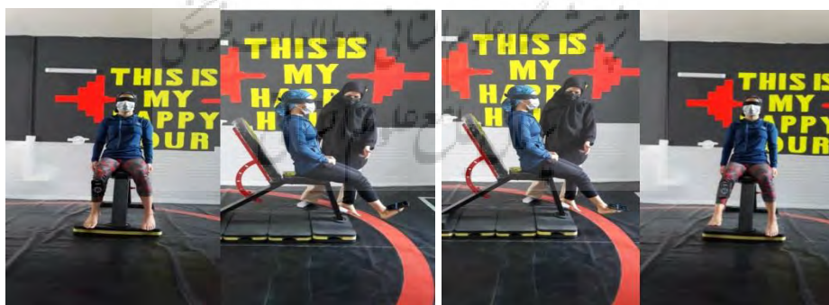
شکل ۱- نحوه اندازه حس وضعیت مفصل مچ پا و زانو