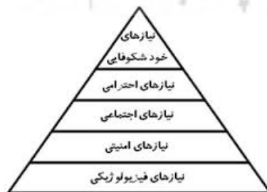
سلسله‌مراتب پنج‌پله‌ای آبراهام مزلو

یکی از نظریه‌پردازان اصلی در مکتب انسان‌گرایی، آبراهام مزلو ۲ است. از نگاه او، آدمی برای رسیدن به بالندگی شخصیتی ملزم به عبور از سلسله‌مراتبی پنج‌گانه (نیازهای فیزیولوژیکی، بدنی یا زیستی؛ نیاز به ایمنی؛ نیاز به عشق و تعلق (نیاز اجتماعی)؛ نیاز به احترام و عزت نفس؛ و نیاز به خودشکوفایی) است، زیرا در هر مرحله ابعادی از شخصیت او آشکار می‌شود و در نهایت به شکوفایی دست پیدا می‌کند. از دید پاردی، این هرم که در سال ۱۹۵۴ میلادی از جانب مزلو ارائه شده است، معمولاً برای دسته‌بندی انگیزش‌ها و نیازهای انسانی به کار برده می‌شود. در پایین‌ترین سطح هرم، نیازهای سطح پایین‌تر قرار دارند که باید پیش از پیدایی نیازهای سطح بالاتر اکتفا شوند (Pardee, 1970: 5). بدیهی است که عدم اکتفا این نیازها نتایج مخربی در زندگی شخصی و گروهی افراد برجای می‌گذارد.