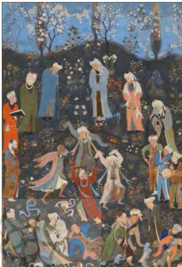
تصویر شماره ۱: «سماع درویشان»، منسوب به بهزاد (کنبی، ۱۳۷۷: ۱۷۸) Picture No. 1: "Sama_e Daravish" attributed to Behzad (Canby, 2005: 178)

چنان که مشاهده می‌گردد؛ نوع جلوس هرمز شاه به شیوه آثار عصر شاه‌رخ و به تقلید از شخصیت تیمور است. در این نگاره‌ها عموماً شاه یک پای خود را جمع کرده