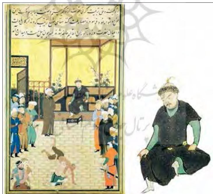
تصویر ۳: (دو کشتی گیر)، گلستان سعدی، هرات ۸۹۱ ه.ق.، (سودآور ۱۳۸۰: ۱۰۴) Picture 3: "Two wrestlers", Golestan Saadi, Herat 891 AH (Soodavar 2001: 104)

رنگ سبز و کمربندی به رنگ مشکی به تن دارد که لباس زیرین رانه به طور کامل اما پوشانده و بر جلوه لباس افزوده است و تاجی به سر دارد شبیه آنچه عموماً در نگاره‌ها بر