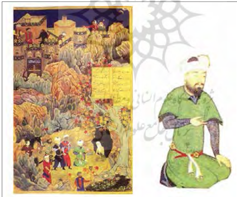
تصویر ۶: «اسکندر و معتکف»، خمسه نظامی، هرات (آزند، ۱۳۸۷: ۴۰۶) Picture 6: "Alexander and Motakaf", Khamseh Nezami, Herat (Azhand, 2008: 406)

در نگاره موجود است (تاج پادشاه در سمت راست نگاره در دست صاحب منصبی است) گویی نگارگر قصد داشته بی میلی شاه را به زرق و برق سلطنت بیان نماید.