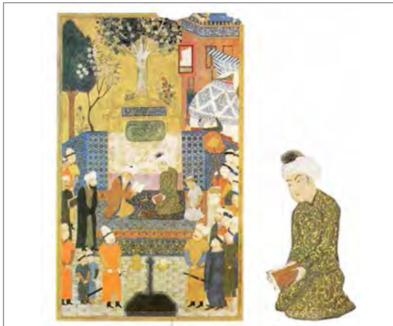
تصویر ۷: «تاج‌گذاری سلطان حسین باقرا»، هرات ۸۷۳ ه.ق، منسوب به منصور (سودآور ۱۳۸۰: ۸۷) Picture 7: "Coronation of Sultan Hussein Bayqara", Herat 873 AH, attributed to Mansour (Soodavar 2001: 87)

در نگاره «جشنی در دربار سلطان حسین میرزا» سلطان حسین با لباسی سبز و دستار (همانند نگاره‌های پیشین) در مجلس اجرای موسیقی به تصویر درآمده است. با حرکتی هوشمندانه توسط نگارگر، با یک قالیچه میان مجلس موسیقی، محل پذیرایی با شراب و سلطان حسین فاصله ایجاد نموده است. برخی از شنوندگان در این نگاره، از آوای موسیقی واله و شیدا شده‌اند، یکی از هوش‌رفته و دیگری جامه چاک می‌دهد که به مجلس سماع درویشان اشاره دارد، یکی از آیین‌هایی صوفیان که شاه شخصاً در آن حضور پیدا کرده