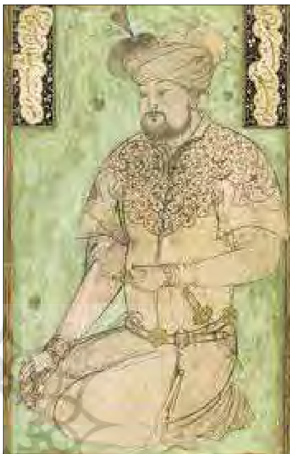
تصویر ۹: «سلطان حسین بایقرا»، رقعہ نگاری، اثر بهزاد (کنبی، ۱۳۷۷: ۱۹۰) Picture 9: "Sultan Hossein Bayqara", Raqqa painting, by Behzad (Canby 2005: 190)

۱۳۸۵: ۱۶۶). بدیهی است که در چنین شرایطی کمیت آثار و متون دینی افزایش می‌یابد و تأثیر خود را بر روی سایر جریان‌های فکری و هنری خواهد گذارد. شاید به جرئت بتوان ادعا کرد در کمتر دوره‌ای این تعداد از شاعران و گویندگان فارسی‌زبان می‌زیسته‌اند. در این زمان سرودن شعر فقط به شاعران نامی محدود نمی‌شد، بلکه گروه‌های مختلفی اعم از شاهان و شاهزادگان و وزیران و هنرمندان دستی در شعر داشتند. برخی از هنرمندان چند هنری بودند و به نحوی با ادب پارسی سروکار داشتند. اصطلاحات عرفانی به شدت در اشعار و آثار صاحبان ذوق و ادب این دوره وارد شد. در قرن نهم و دهم هجری کمتر شاعر و یا هنرمندی را می‌بینیم که از ذوق عرفانی بی‌بهره مانده باشد و جلوه‌هایی از آن در آثارش دیده نشود. جامی با توجه به ارتباط صمیمانه‌ای که به عنوان نماینده فرقه نقشبندی با دربار هرات به‌ویژه امیرعلی شیرنوایی داشت، همچنین بنا به مقام علمی و ادبی خود، تأثیر فراوانی بر طرز تفکر درباریان و هنرمندانی که به آنان