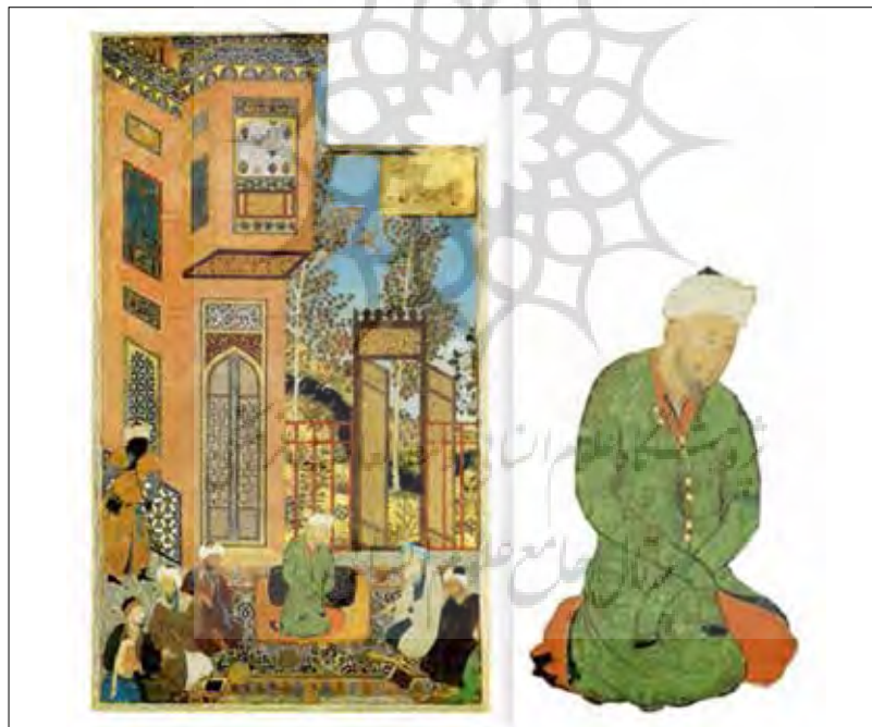
تصویر ۴: (تولد یک شاهزاده)، هرات ۸۸۴ ه.ق، منسوب به بهزاد، (سودآور، ۱۳۸۰: ۹۹).

خانقاه‌ها و معابد با ترکیه نفس خود را برای مقابله با نفس آماده می‌کردند و پهلوانان نیز در زورخانه‌ها با تقویت قوای جسمانی آماده مبارزه با دشمن بیرونی و درونی می‌شدند (Arthur.E.1944: 56). در بعضی از تصاویر جلوس شاهانه، شاهی بدون مشخص بودن هویت آن، به تصویر درآمده تا حکایت یا داستانی به کمک او در نگاره نقل گردد. به طور مثال در نگاره "دو کشتی‌گیر" پادشاهی که بر تخت نشسته مشخص نمی‌باشد. در این نگاره پادشاه زیر سایبانی جلوس کرده و شخصی که در سمت راست و نزدیک وی ایستاده احتمالاً وزیر وی می‌باشد که دستار بر سر دارد. در میان درباریان شخصی با تاج و لباسی با آستین‌های بلند، همچون لباس صوفیان، دیده می‌شود که به احتمال زیاد شاهزاده (نایب‌السلطنه) باشد. شاه تاج بر سر گذارده، یک پایش را جمع کرده و لباسی که آستین‌های آن به رنگ سبز می‌باشد، پوشیده است. احتمال دارد