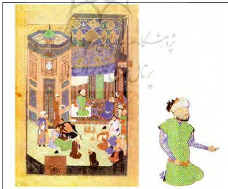
تصویر ۸: «جشن دربار سلطان حسین بهزاد»، سرلوحه کتاب بوستان، هرات ۸۹۳ ه.ق (کنبی، ۱۳۷۷: ۱۷۶) Picture 8: "Celebration of the court of Sultan Hossein Behzad", the title of the book Bustan, Herat 893 AH (Canby, 2005: 176)

در نگاره «جشنی در دربار سلطان حسین میرزا» سلطان حسین با لباسی سبز و دستار (همانند نگاره‌های پیشین) در مجلس اجرای موسیقی به تصویر درآمده است. با حرکتی هوشمندانه توسط نگارگر، با یک قالیچه میان مجلس موسیقی، محل پذیرایی با شراب و سلطان حسین فاصله ایجاد نموده است. برخی از شنوندگان در این نگاره، از آوای موسیقی واله و شیدا شده‌اند، یکی از هوش‌رفته و دیگری جامه چاک می‌دهد که به مجلس سماع درویشان اشاره دارد، یکی از آیین‌هایی صوفیان که شاه شخصاً در آن حضور پیدا کرده