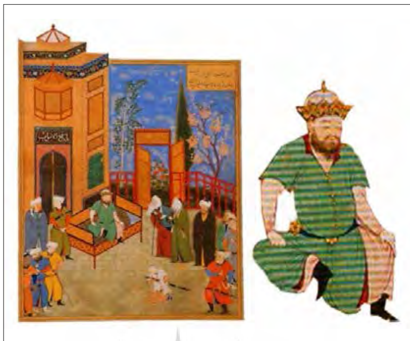
تصویر شماره ۲: (نگاره کفن پوشیدن خسرو)، منسوب به بهزاد (کنبی، ۱۳۷۷: ۱۷۸) Picture No. 2: "Khosrow wearing a shroud" attributed to Behzad (Canby 2005: 178)