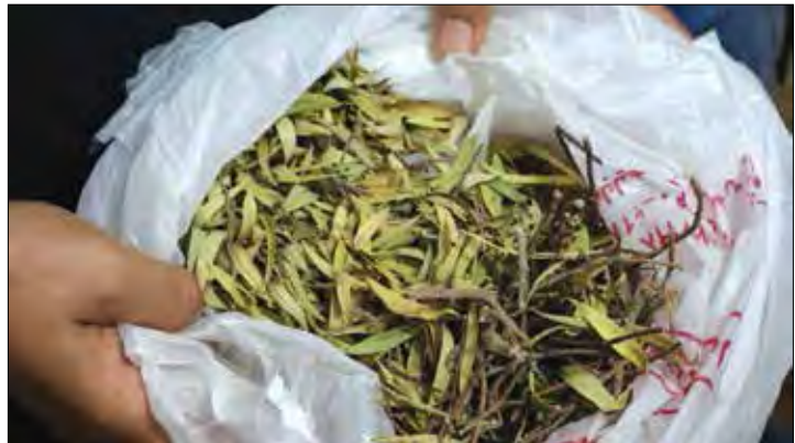
تصویر شماره (۴): گیاه خوشک یا مردار آغاجی (نگارنده) Figure4: kheveshk plant / mordar Aghaji (writer)

قبل از اتمام سال فعالیتشان را دوبرابر کرده و کار بافت را به اتمام برسانند تا بتوانند از فرصت زمان باقی مانده برای خانه‌تکانی استفاده کنند. اگر گاهی پشم در حین بافت کم می‌آید، چنان‌چه در وسط کار بود، از همسایگان قرض می‌گرفتند ولی اگر در ابتدای کار بود، دستبافته‌شان را متناسب با پشم موجود انتخاب می‌کردند. در زیر روایت یکی از مضاحبه‌شوندگان از طایفه قشقایی در مورد فرایند تولید دستبافته‌هایشان آورده شده است. برنامه کار بافت طایفه قشقایی از گذشته تا کنون: "از نیمه‌های اسفندماه پشم‌چینی آغاز شده و از ابتدای بهار تا بعد از نوروز پشم‌های چیده شده را می‌ریسیدند، سپس اولین بافته را در سایز ۱.۵ در ۷۵ (کناره) می‌بافتند. پس از بافت، کوچ به سمت سرحد داشتند، گاهی در اسفندماه و گاه در فروردین کوچ می‌کردند و این کوچ بسته به شرایط آب‌وهوایی و باران‌های بهاری فارس داشت. ۵۵ روز بعد از عید به مدت ۱۰ روز مجدد پشم‌چینی انجام می‌شد. حدوداً خردادماه بافت جاجیم در ابعاد نزدیک به ۱/۵ در ۲/۵ به مدت ۲۰ روز (شش‌ه درمه ۱۰ یا گچمه ۱۱...) و تیرماه بافت قالیچه حدوداً ۲ متری که تا شهریور باید تمام