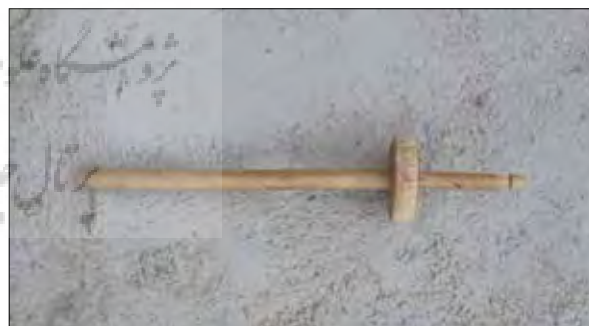
تصویر شماره (۶): پره یا کرمان (نگارنده)

در بهار و پیش از چیدن پشم، گوسفندها را در رودخانه می‌شستند. سپس پشم‌ها را قیچی کرده و تبدیل به نخ می‌کردند و مجدد آن را شسته و رنگ می‌کردند. برای شستن پشم و کلاف‌ها از ریشه گیاه چوگا که قلمی و سفیدرنگ بود استفاده می‌کردند بدین صورت که ابتدا آن را می‌کوبیدند و بعد به شکل پودر بر روی بند و نخ می‌پاشیدند. عملیات پشم‌ریسی نیز معمولاً عصرها انجام می‌گرفت و زنان دور هم جمع شده و به صورت رقابتی این کار را انجام می‌دادند. پس از اتمام ریسیدن، مجدد این نخ‌ها را جفت