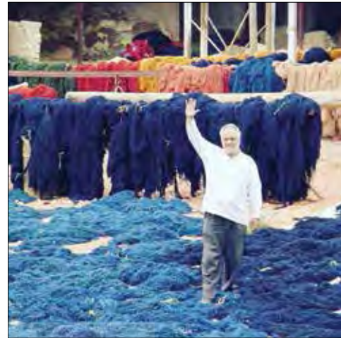
تصویر شماره (۲ و ۳): کارگاه رنگری مرحوم عباس سیاهی در سلطان‌آباد (از مجموعه تصاویر موجود در کارگاه / نگارنده)