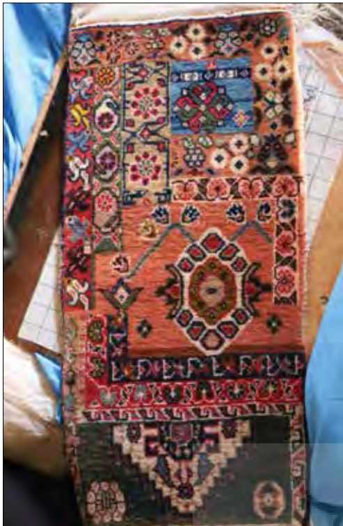
تصویر شماره (۵): نمونه دستور یا الگوی بافته شده (نگارنده) Figure5: Sample woven pattern (writer)

قبل از اتمام سال فعالیتشان را دوبرابر کرده و کار بافت را به اتمام برسانند تا بتوانند از فرصت زمان باقی مانده برای خانه‌تکانی استفاده کنند. اگر گاهی پشم در حین بافت کم می‌آید، چنان‌چه در وسط کار بود، از همسایگان قرض می‌گرفتند ولی اگر در ابتدای کار بود، دستبافته‌شان را متناسب با پشم موجود انتخاب می‌کردند. در زیر روایت یکی از مضاحبه‌شوندگان از طایفه قشقایی در مورد فرایند تولید دستبافته‌هایشان آورده شده است. برنامه کار بافت طایفه قشقایی از گذشته تا کنون: "از نیمه‌های اسفندماه پشم‌چینی آغاز شده و از ابتدای بهار تا بعد از نوروز پشم‌های چیده شده را می‌ریسیدند، سپس اولین بافته را در سایز ۱.۵ در ۷۵ (کناره) می‌بافتند. پس از بافت، کوچ به سمت سرحد داشتند، گاهی در اسفندماه و گاه در فروردین کوچ می‌کردند و این کوچ بسته به شرایط آب‌وهوایی و باران‌های بهاری فارس داشت. ۵۵ روز بعد از عید به مدت ۱۰ روز مجدد پشم‌چینی انجام می‌شد. حدوداً خردادماه بافت جاجیم در ابعاد نزدیک به ۱/۵ در ۲/۵ به مدت ۲۰ روز (شش‌ه درمه ۱۰ یا گچمه ۱۱...) و تیرماه بافت قالیچه حدوداً ۲ متری که تا شهریور باید تمام