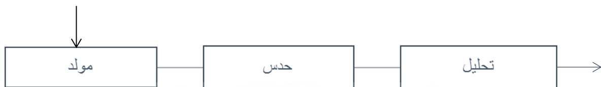
نمودار شماره ۳: مدل فرایند طراحی جین دارکی

مدل جین دارکی ۵ از نظر مدل دارکی فرایند طراحی مشتمل بر مولد، حدس و تحلیل می باشد به زبان ساده ابتدا مشخص می شود چه چیزی ممکن است جنبه مهم مسئله باشد بر اساس آن طرحی ابتدایی به وجود می آید و سپس راه حل انتخاب شده مورد آزمون قرار می گیرد. در مدل دارکی، معماران در مقابل همه پیچیدگی های طراحی در همان اوایل فرایند طراحی به فکری نسبتاً ساده تمسک می جویند تا زنجیره راه حل های ممکن را محدود کنند. در نتیجه طراح قادر می شود به سرعت طرح کلی را سازماندهی کرده و تحلیل کند. این مدل مبتنی است بر تقدم به کارگیری اصل یا الگویی سازمان دهنده برای هدایت فرایند تصمیم گیری بطوریکه بر همزمانی یا تقدم تحلیل بر ترکیب تاکید می نماید (Hillier, Musgrove and O'sullivan 1972) (نمودار شماره ۳).