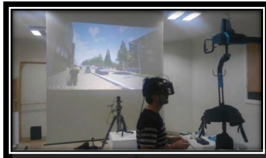
شکل شماره (۷) فرد مورد آزمون

• از موارد دیگری که فرد مورد آزمون به آن اشاره کرده است راحت بودن محیط آزمون از نظر اجرای آزمون در یک فضای بسته یا هوای مناسب میباشد، نکته جالب توجه در این اظهار نظر توجه به شرایط آب و هوایی محیط انتخاب شده برای استفاده از ابزار واقعیت مجازی به منظور مشارکت افراد می باشد. زیرا با توجه به استفاده از عینک های واقعیت مجازی که ممکن است باعث خستگی و تعرق افراد شود هوای مناسب و راحتی جز نکات کلیدی جهت جذب افراد به این نوع از مشارکت می باشد.