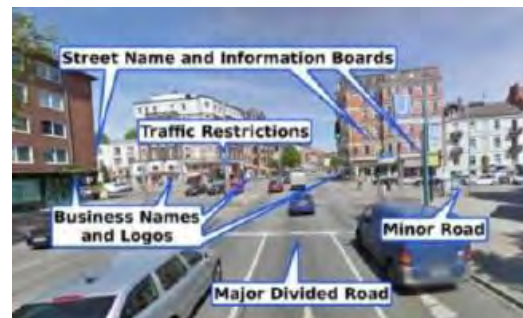
شکل (۱) سرویس (street view) از گوگل