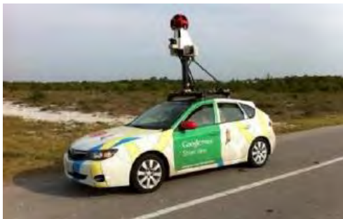
شکل (۲) اسکنر های گوگل

با توجه به امکانات روزافزون و تسهیلات فراهم آمده توسط پیشرفت تکنولوژی و همچنین نظریه های جدید شهری مانند شهروشمند که در آنها ردپای استفاده از اپلیکشن ها و تکنولوژی های جدید دیده می شود، میتوان از امکانات و لوازم جدیدی به منظور افزایش مشارکت شهری نیز استفاده کرد، مانند اپلیکشن های موبایل، سرویس های گوگل، ابزار های واقعیت مجازی و... ، همانطور که پیش تر گفته شده است، عینک های واقعیت مجازی میتوانند تاثیر بسیار زیادی را در زمینه مشارکت شهری بگذارند، این عینک ها به بیان ساده به شهروندان این امکان را می دهند که آینده طراحی شده شهر خود را ببینند و در مورد آن نظر بدهند یا اگر میخواهد آن را به میل خود تغییر دهد، این موضوع سبب مشارکت، افزایش علاقه و جذابیت برای شهروندان و همچنین باعث حس تعلق شهروندان میشود، زیرا به نوعی قسمتی از طراحی و برنامه ریزی شهر، از این طریق به آن ها واگذار شده است (Schubler, 1996:25).