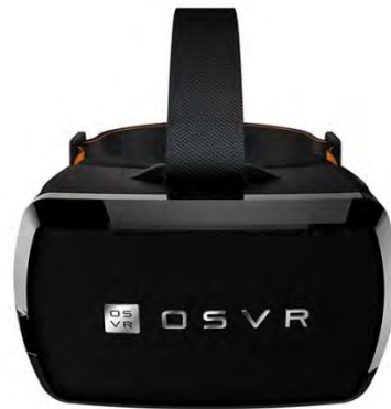
شکل شماره (۵) عینک واقعیت مجازی

هدست در آزمایشگاه واقعیت مجازی و نداشتن گزینه دیگر، این هدست برای پژوهش مورد نظر انتخاب شده و از آن استفاده می‌شود (EnniS, 1997:155).