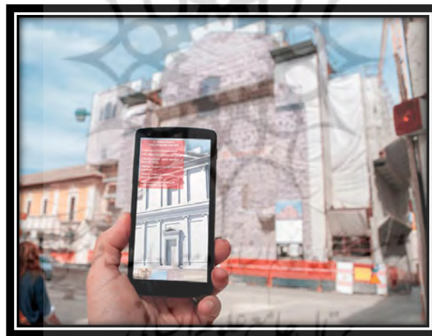
شکل (۳) استفاده از واقعیت افزوده در طرح های شهری

با استفاده از این نوع تکنولوژی میتوان ابعاد جدیدی به مشارکت شهری افزود و آن را فرآیندی بسیار هیجان انگیزتر و جذاب تر کرد، به طور مثال میتوان برای هر ایده یا تغییری که در محدوده ای قرار است اتفاق بیوفتد یک کد تعریف کرد و آن را به دیوار و جایی که در آن محدوده قابل مشاهده برای همه افراد باشد چسباند، سپس شهروندان با اسکن کردن آن کد با گوشی خود میتوانند از طریق دوربین گوشی تمامی تغییرات حادث شده در طرح را رویت کنند و حتی نظر خود را به طور مثال از طریق جابه جایی مبلمان موجود در طرح در صفحه گوشی خود و یا گذاشتن کامنت ابراز کنند، که از این طریق برنامه ریز میتواند برآیند نظرات را مشاهده و تغییرات لازم را اعمال کند (Falksm, 2000:35).