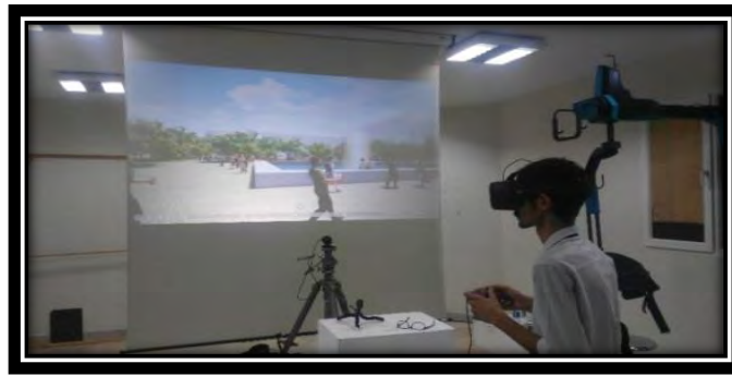
شکل شماره (۸) فرد مورد آزمون