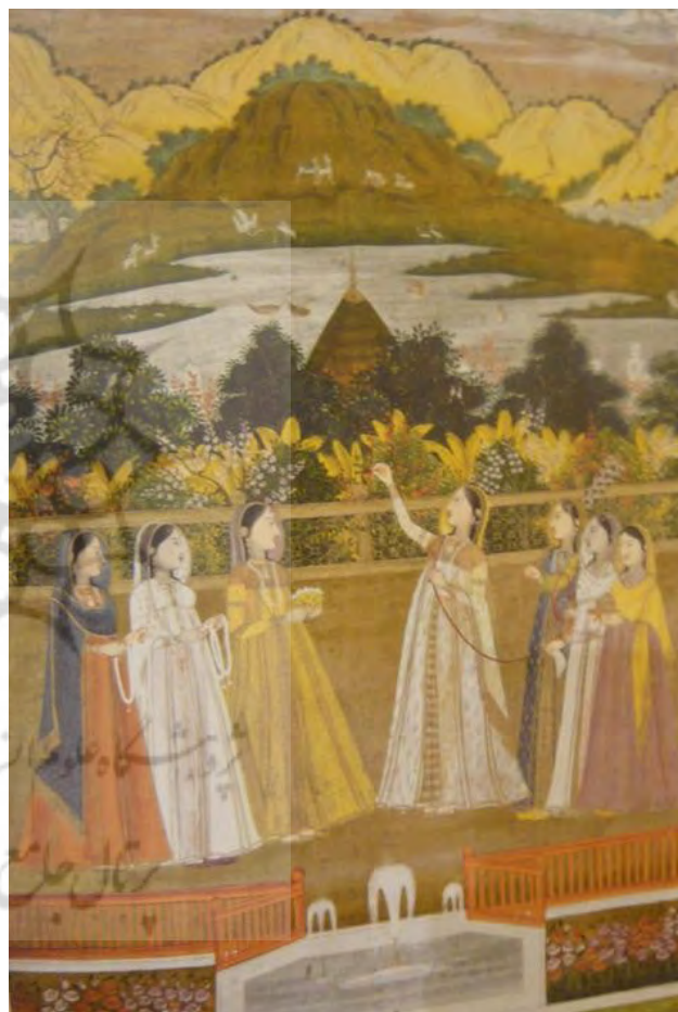
تصویر ۹. حضور گیاهان بومی در پس‌زمینه و خلوت بودن زمینه، روایت در دل طبیعت که در پس‌زمینه گیاهان بومی هند، کوه و آسمان را نشان می‌دهد. زمینه خلوت و بدون نقش است. در مینیاتور ایرانی جای خالی و بدون نقش دیده نمی‌شود.

است. باغ و باغ‌سازی با الگوی ایرانی که حال و هوایی ویژه دارد و منظر روح‌افزا و آرام‌بخش آن، با روحیات شاعرانه و احساسی ایرانیان سازگاری داشته و قرن‌ها با حیات مردم عجین بوده و هست. این هنر بی‌ظنیر به شرق و غرب عالم از سرزمین هند و عثمانی، تا شمال آفریقا و اسپانیا هم بال گشوده، به همین شکل مینیاتور ایرانی نیز به این سرزمین‌ها رفته و باغ و بوستان را به