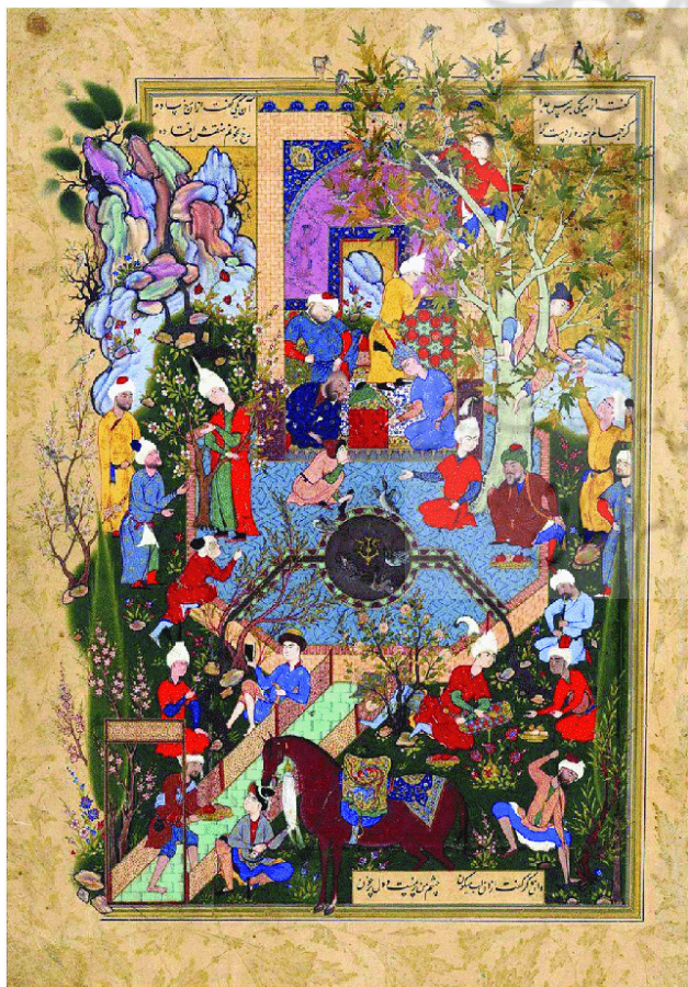
تصویر ۲. هفت اورنگ جامی، بزم شاهانه که در باغ و دل طبیعت جلوه‌گر شده، آنچه در باغ و کوشک بوده (گردش آب، درختان چنار، سرو و شکوفه و...) همگی به شکل واقعی تصویر شده‌اند.