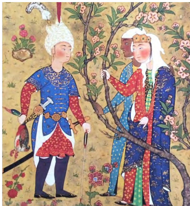
تصویر ۶. شاهنامه طهماسبی، گل ختمی و درخت شکوفه که به شکل واقعی ترسیم شده است.

مینیاتور ایرانی سندی مهم و با ارزش و جلوه‌ای بی‌نظیر از باغ ایرانی را به نمایش گذاشته است. باغ ایرانی با پیشینه‌ای دور فرهنگ و باور نیاکان را مبنی بر تقدس طبیعت و عناصر زمینی و آسمانی آن بازسازی نموده و در گذر زمان از روزگاران استوره‌ای و تاریخی این مرز و بوم تا دوران اسلامی و تا کنون برجای و استوار