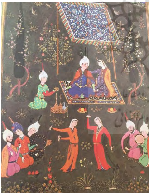
تصویر ۵. دیوان حافظ، بزم در باغ با تمام جزئیات از فرش و سایبان، انواع گل‌ها و گیاهان و بوته‌ها که کاملاً واقعی به تصویر درآمده‌اند.

الگوی باغ-معبده‌های اعیان و اشراف و به تدریج تسری این الگو در خانه‌های ایرانی به وضوح در مینیاتورها دیده می‌شود. نقاشی ایرانی با الگوهای ذکر شده و شیوه ویژه در نقش‌پردازی، به هند و ترکیه