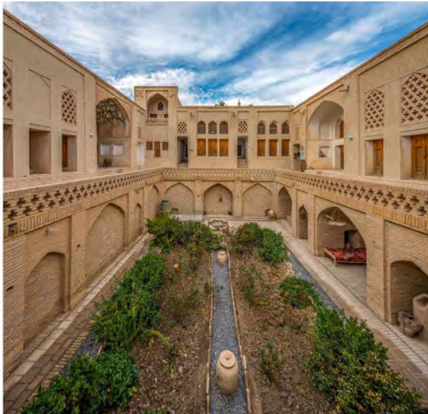
تصویر ۴. خانه پیرنیا نابین، خانه ایرانی با الهام از معماری براساس باورها که آب و گیاه و چهارتاقی عناصر اصلی آن هستند، چشمه و درخت مقدس در قالب باغچه و حوض با درختان انار، انجیر و انگور دیده می‌شوند. شاه‌نشین یا ایوان اصلی که همان چارتاقی و مشرف بر حوض است نیز دیده می‌شود.