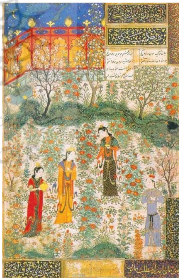
تصویر ۷. همای و همایون، سبزه‌زار با انواع گل و بوته‌های بومی که در باغ ایرانی، باغچه و حیاط‌ها بوده است و جویبار و پلان جلو که عشاق را نشان می‌دهد، ردیف درختان با آسمان لاجوردی و نمایش شب در بالا و روز در پایین باغ نیز از نکات جالب توجه است.