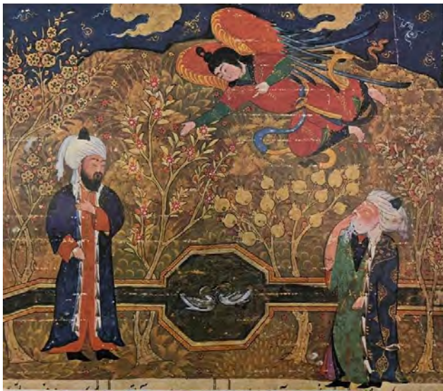
تصویر ۱. خاوران نامه، اعلان تمجید و امامت امام علی (ع) توسط جبرئیل به پیامبر (ص)، این روایت مذهبی در باغ به تصویر آمده است، حوض و آبراه، درخت انار با میوه‌های طلایی و گل انار، درخت شکوفه، آسمان لاجوردی و ابرهای طلایی ترکیبی از واقعیت و خیال در تصویرسازی است.