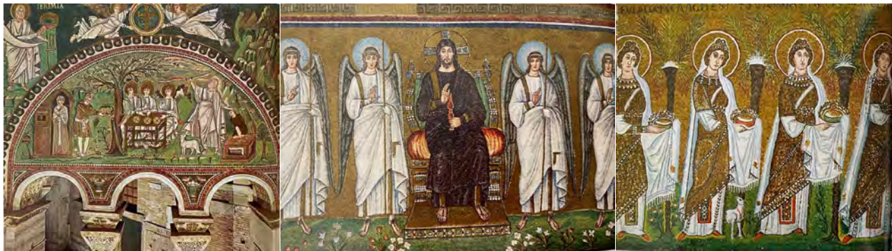
تصویر ۸. کلیسای سنت آپولیناره، روایت مسیحی که در دل طبیعت ترسیم شده و زمینه کار مانند مینیاتور ایران با سبزه‌زار و گل و بوته و درختان است.