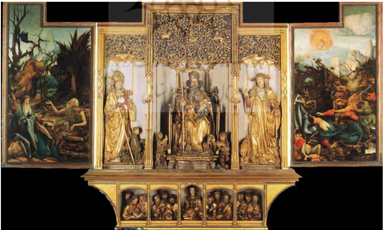
تصویر ۱. تابلوی ماتیاس با موضوع رنج مسیح (اولین تصویر از اثر هنری آیزنهایم. سنت سباستین، مصلوب، سنت آنتونی، دفن، ۱۵۱۶، موزهٔ آنترلیندن، کولمار، فرانسه).