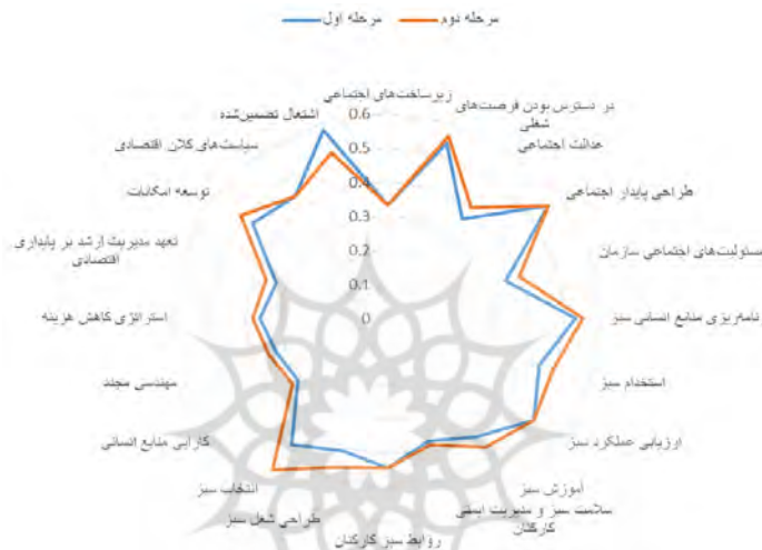
شکل ۱. مقایسه نتایج مرحله اول و دوم نظرسنجی خبرگان

همان‌گونه که جدول ۴ نشان می‌دهد در تمامی مؤلفه‌ها، اعضای گروه به وحدت نظر رسیده‌اند و میزان اختلاف نظر در مرحله اول و دوم کمتر از حد آستانه است؛ بنابراین نظرسنجی دیگر متوقف می‌شود، شکل ۱ مقایسه نتایج نظرسنجی مرحله اول و دوم را نشان می‌دهد.