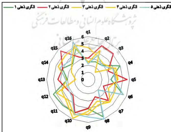
شکل ۳. نمودار تار عنکبوتی الگوهای ذهنی مشارکت‌کنندگان از اثرات امنیتی اقامتگاه‌های غیر رسمی