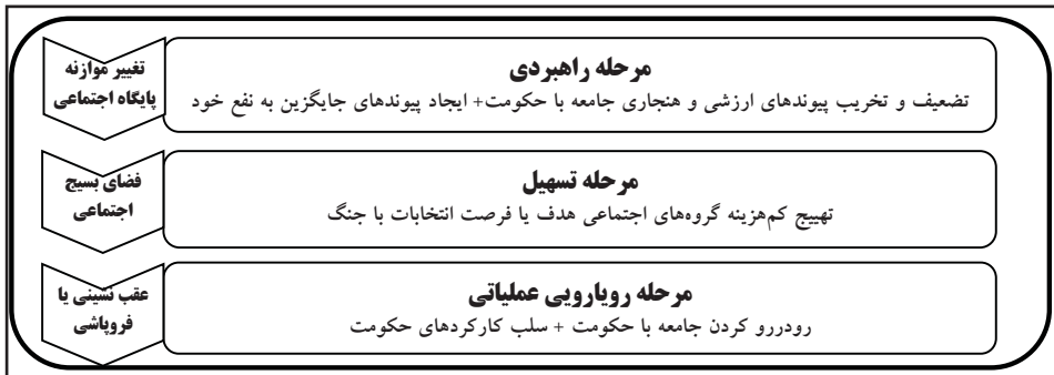
شکل ۱. فرایند کلی تهدید نرم (حسینی، ۱۳۸۹، ص ۴۲)

«رفیع‌پور» مراحل تحت تأثیر قرار گرفتن افراد جامعه را در برابر تبلیغات (و تهدید نرم) در