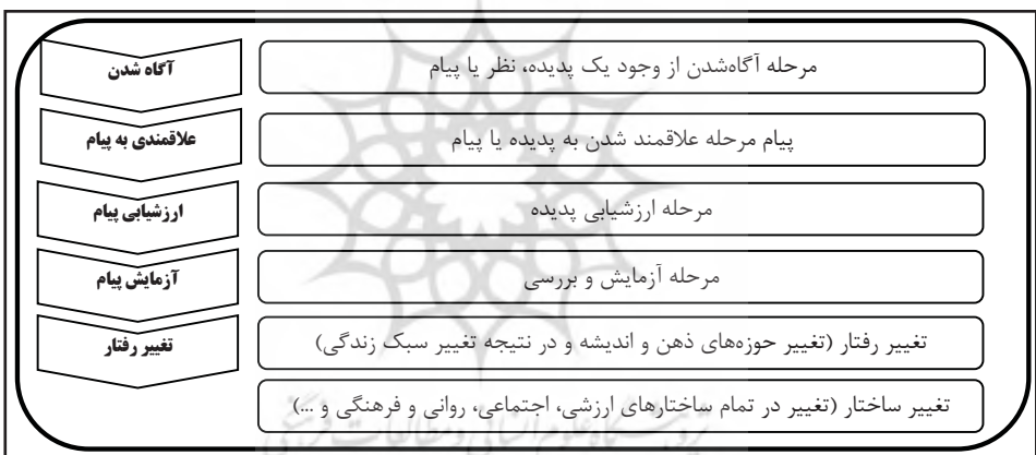
شکل ۲. مراحل تحت تأثیر قرار گرفتن افراد جامعه را در برابر تبلیغات

براساس نظر «ارونسون» و «پراتکانیس» ۱ (۲۰۰۳) افراد روشنفکر زودتر از سایر افراد جامعه در برابر تهدید نرم، (به‌خصوص در حوزه فرهنگی) این مراحل را طی می‌کنند و رفتار خویش را تغییر می‌دهند. می‌توان نتیجه گرفت که عاملان تهدیدات نرم، همه افراد و گروه‌های جامعه آماج را مخاطب قرار می‌دهند. ولی، برای هر یک از گروه‌های مخاطب، از ابزارها و شیوه‌های مختلفی بهره می‌گیرند (عقیلی و مصطفوی، ۱۳۹۲، ص ۳۵). با توجه به موارد بیان‌شده می‌توان هرم مخاطبان در تهدید نرم را به‌صورت شکل ۳ ترسیم کرد: