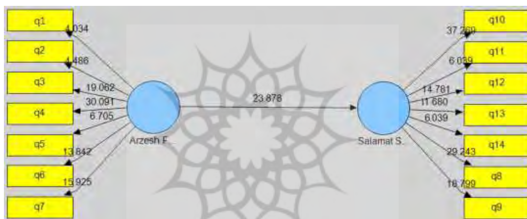
شکل ۱: مقادیر T-Value

شکل شماره ۱ مقادیر T-Value بدست آمده را برای مسیرها نشان می‌دهد. چنانچه میزان T-value