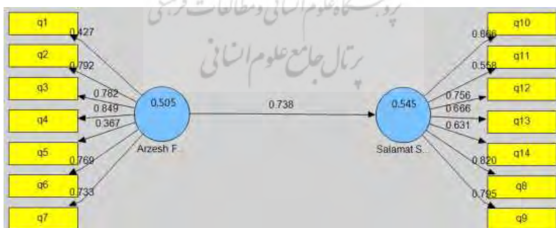
شکل ۲: مقادیر ضرایب مسیر