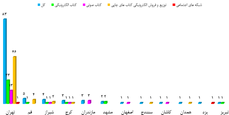
شکل ۱. توزیع جغرافیایی استارت‌آپ‌های حوزه کتاب در ایران

با توجه به بررسی‌های صورت پذیرفته در مجموع ۱۵۴ استارت‌آپ در حوزه نشر کتاب در کشور فعال هستند. همان‌طور که در نمودار فوق قابل مشاهده است شهرستان‌های تهران، قم و شیراز به ترتیب با داشتن ۸۳، ۵ و ۴ استارت‌آپ در رتبه‌های برتر قرار دارند. اکثر استارت‌آپ‌های شهرهای بزرگ نیز به توزیع و فروش الکترونیکی کتاب‌های چاپی پرداخته‌اند و استارت‌آپ‌های کتاب الکترونیکی و کتاب صوتی در مراحل بعدی قرار دارند که این امر می‌تواند ناشی از وجود مراکز آموزشی، پژوهشی و دینی در این استان‌ها باشد. شایان ذکر است که مکان ۲۸ مورد از استارت‌آپ‌ها در بخش کتاب الکترونیکی، ۱۰ مورد در بخش توزیع و فروش الکترونیکی کتاب‌های چاپی، ۶ مورد در بخش کتاب صوتی و ۳ مورد در بخش شبکه‌های اجتماعی نامشخص بوده است.