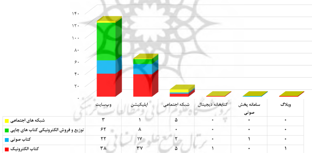
شکل ۳. توزیع انواع بسترهای فعالیت استارت‌آپ‌های حوزه کتاب ایران

همان‌گونه که در شکل ۲ هویداست می‌توان به آغاز فعالیت استارت‌آپ توزیع و فروش الکترونیکی کتاب‌های چاپی چون «شرکت ویژه نشر» در تهران در قالب وبگاه و جهش یکباره تشکیل سایر استارت‌آپ‌ها از سال ۱۳۹۰ به بعد و اوج‌گیری آن‌ها در سال‌های ۱۳۹۵ با ۱۷ و ۱۳۹۶ با ۱۴ استارت‌آپ اشاره نمود. در این بین میزان رشد استارت‌آپ‌های حوزه کتاب صوتی و همچنین توزیع و فروش الکترونیکی کتاب‌های چاپی به نسبت انواع استارت‌آپ‌های دیگر بیشتر بوده است. گرانی کاغذ، افزایش هزینه‌های سفر برای خرید کتاب چاپی، افزایش ضریب نفوذ اینترنت و ارزانی آن، توسعه تلفن‌های همراه هوشمند و فناوری‌های کتابخوان الکترونیکی از سوی شرکت‌های مختلف، کمبود وقت افراد برای خواندن کتاب‌های چاپی، اعطای نشان ملی ثبت رسانه‌های دیجیتال از جانب مرکز فناوری اطلاعات و رسانه‌های دیجیتال وزارت فرهنگ و ارشاد اسلامی و اعطای نماد اعتماد الکترونیکی از سوی مرکز توسعه تجارت الکترونیکی وزارت صنعت، معدن و تجارت به عنوان شناسنامه کسب‌وکارهای اینترنتی در سال‌های اخیر را می‌توان از عواملی برشمرد که موجب رواج و گسترش این استارت‌آپ‌ها شده است.