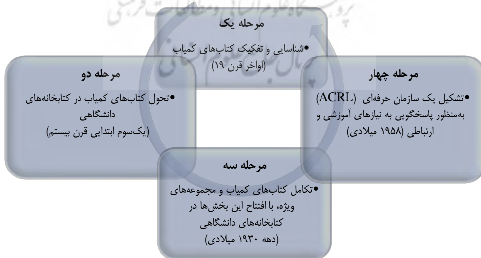
شکل ۱. مراحل تحول مجموعه‌های ویژه در جهان در طول تاریخ

بررسی ریشه‌ها و عوامل پیشرفت کتابخانه‌های دانشگاهی آمریکا در اواخر قرن هجدهم و قرن نوزدهم، ما را به مجموعه اقدامات قرن نوزدهم هدایت می‌کند که موجب ظهور پدیده کتاب‌های کمیاب و مجموعه‌های ویژه در قرن بیستم شده است؛ در واقع در آمریکا، وابستگی متقابلی میان سه مقوله حوزه‌های علمی، تحولات آموزش عالی و کتاب‌های کمیاب و مجموعه‌های ویژه وجود دارد. به طور کلی، سیر تاریخی کتاب کمیاب در غرب را می‌توان به چهار مرحله تقسیم کرد (شکل ۱).