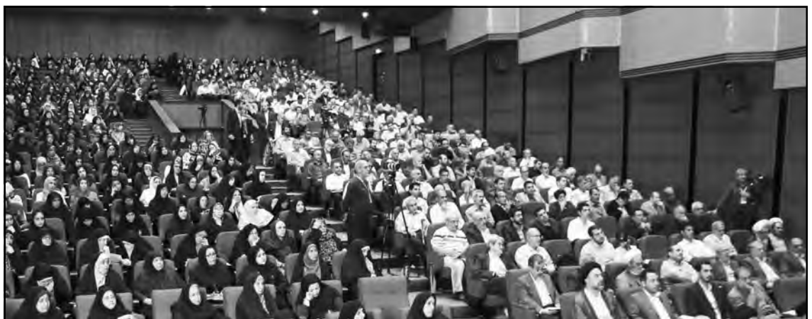
این عکس مربوط به آرشیو همایش سال ۱۳۹۸ است.

همان صراط مستقیم است. قرآن مجید از این انحراف بشر به «فسق» و «کفر» (کفران نعمت) و «فساد» (یعنی برهم زدن دستگاه طبیعت) تعبیر میکند، که ثمره آن، بحکم قوانین قاطع و سنن الهی ثابت و قواعد تاریخ و فلسفه آن، انواع شرور و خطرها و آسیبها و ضررها میباشد؛ مانند بلاهای طبیعی، خشکسالی، ظهور حشرات و موجودات مضر و بویژه بیماریهای مسری و کشنده مانند وبا و طاعون و ویروسهای دیگر، که در تاریخ آمده و امروز نیز در جهان دیده میشود. کیفر اعمال و گناه بشر گرچه بصورت عواملی طبیعی و بیماری ظاهر میشود ولی همه اینها دستاورد خود بشر و نتیجه کردار غلط و نادرست او میباشد، یعنی اساساً شرّ در خلق جهان نیست مگر آنکه جهان از دست آزار بشر و نافرمانی او بتنگ آمده و او را به کیفری مبتلا سازد. این رفتار جهان، رفتاری ناخواسته است و گویی روح بزرگ حاکم بر جهان بر اساس و بحکم قانون عدل (یعنی لزوم حفظ اعتدال و نظم جهان و دوام آن بر منهای حکمت و حکم الهی)، خود را موظف مبیند که برهمزنان نظم نظام آفرینش و جهان طبیعت را گوشمالی دهد و آنها را به رعایت این نظم سراسر خیر وادار سازد. «انذار» و «تبشیر»، دو وظیفه انبیاء، همه برای این بود که بشر را به خیر و سعادت رهنمون شوند و او