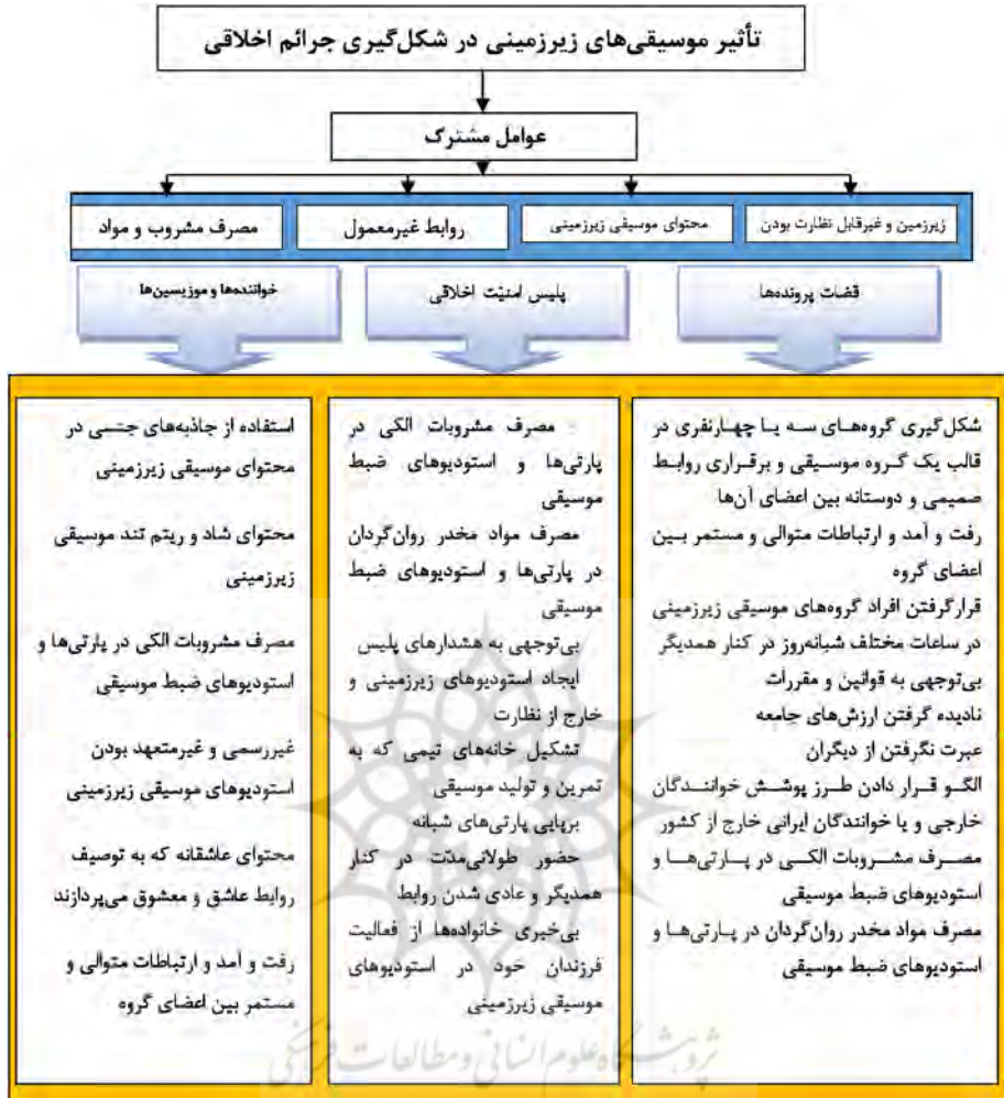
شکل ۱. عواملی که به‌طور کلی در شکل‌گیری جرائم اخلاقی دخیل‌اند

همان‌گونه که در جدول آمده، مهم‌ترین موارد مشترک میان مصاحبه‌شونده‌ها در خصوص علل گرایش به جرائم اخلاقی مشخص شده است. درحالی که قضات به عوامل قانونی و مقررات جامعه و آنچه کدهای رسمی است، اشاره دارند (مانند بی‌توجهی به قوانین و مقررات / نادیده گرفتن ارزش‌های جامعه / عبرت نگرفتن از دیگران / الگو قرار دادن طرز پوشش خوانندگان خارجی و یا خوانندگان ایرانی خارج از کشور / مصرف مشروبات الکلی در پارتی‌ها و استودیوهای ضبط موسیقی / مصرف مواد مخدر روان‌گردان