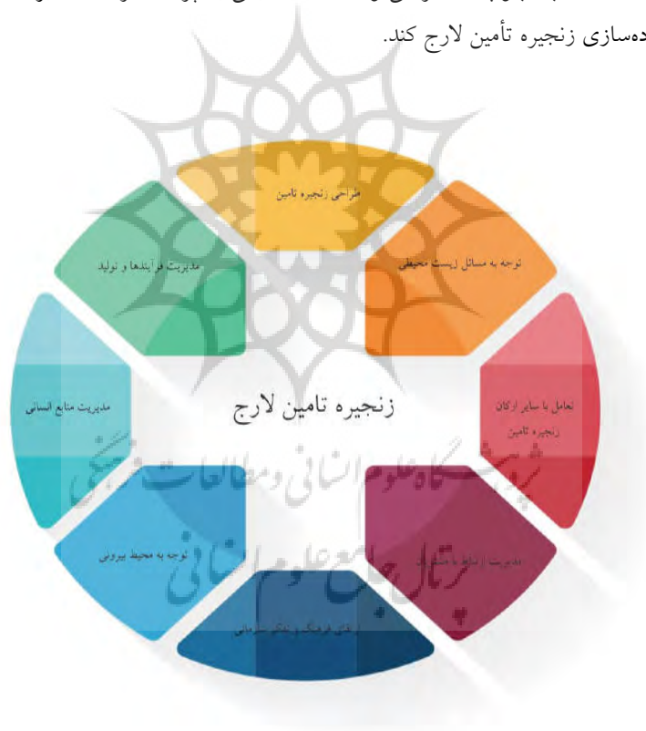
شکل ۲. الگو جامع عوامل کلیدی زنجیره تأمین لارج

فرا ترکیب روشی است که با استفاده از واژه‌های کلیدی، متغیرهای بیشتری مورد مطالعه قرار می‌گیرند و با ترکیب پژوهش‌های کیفی پیشین چارچوب گسترده‌تری نسبت به پژوهش‌های پیشین ارائه می‌دهند. براساس این روش، چارچوب نهایی زنجیره تأمین لارج در قالب یک الگو مفهومی جامع براساس شکل ۲ ارائه شد که هر بعد نیز شامل مؤلفه‌هایی است که در مراحل روش فرا ترکیب به آنها اشاره شده است. بنابراین باتوجه به اینکه چارچوب پیشنهادی و ابعاد و عوامل شناسایی شده مورد تأیید خبرگان و کارشناسان متخصص حوزه زنجیره تأمین قرار گرفته است، چارچوب حاضر می‌تواند کمک شایانی به پژوهشگران و مدیران سازمان‌ها برای پیاده‌سازی زنجیره تأمین لارج کند.