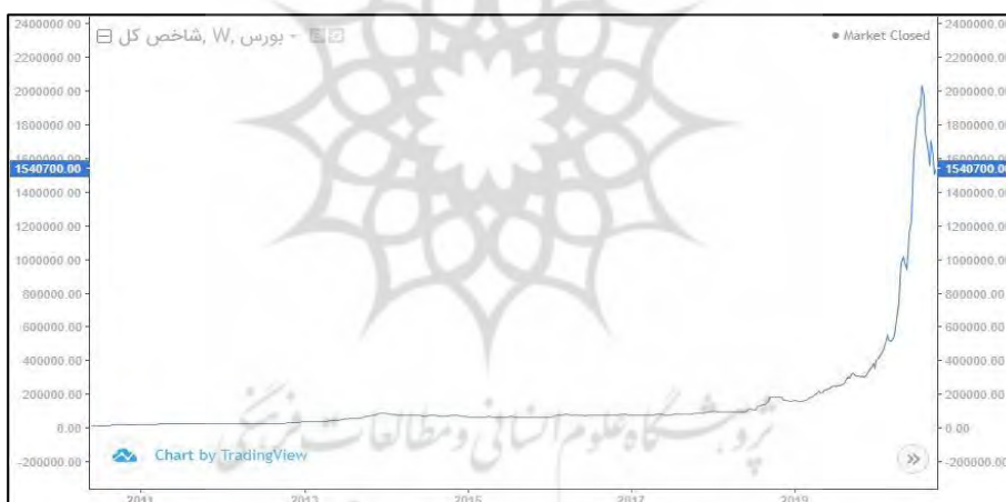
شکل ۴. حجم جستجوی عبارت شاخص کل در محدوده کشور ایران از تاریخ ۲۰۱۰/۱/۱ تا ۲۰۲۰/۱۱/۳۰