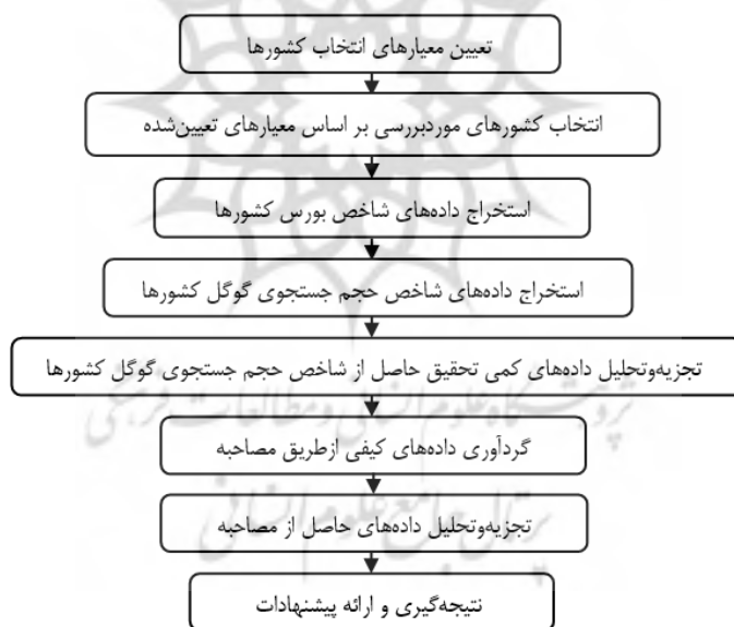
شکل ۲. مراحل انجام تحقیق

مصاحبه با خبرگان به صورت باز و عمیق صورت گرفت و اشباع نظری به عنوان ملاک کفایت نمونه‌گیری در نظر گرفته شد. پس از مصاحبه باز و عمیق با ۱۸ نفر، اشباع نظری داده‌ها تحقق یافت. با این وجود، طبق توصیه‌های انجام‌شده در پژوهش‌های کیفی، دو مصاحبه تکمیلی دیگر نیز صورت گرفت تا تعداد نمونه‌های بخش کیفی به ۲۰ برسد و از تحقق اشباع نظری داده‌های مصاحبه اطمینان حاصل شود. مبتنی بر تجزیه و تحلیل داده‌های حاصل از مصاحبه، یافته‌های تحلیل و راهکارهایی برای بهبود روند بازار بورس ایران پیشنهاد شده است. شکل (۲) فرایند تحقیق را نشان می‌دهد.