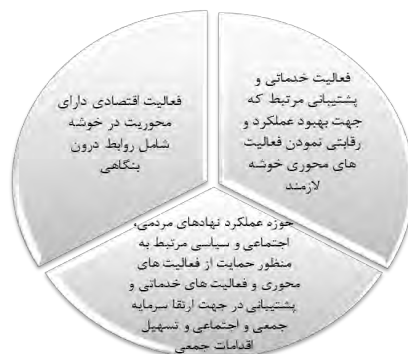
شکل ۱: عناصر اصلی تشکیل‌دهنده خوشه و نحوه استقرار آن‌ها (رحمانی، ۱۳۹۳، ۶)

کلید موفقیت و هویت در یک خوشه وابستگی‌های درونی آن‌ها و نهادهای داخلی است. وابستگی میان بنگاه‌ها به وسیله واسطه‌ها و همکاری ایجاد می‌شود که تسهیل‌گر آن‌ها نهادهای عمومی، دولتی و یا محلی است، نقش راهبردی را در تامین زیرساخت‌های فیزیکی از جمله، ارائه خدمات و تسهیلات متعدد و هماهنگ کردن بخش‌های مختلف و نهادهای سیاسی و اقتصادی منطقه‌ای با تشکیل صنعتی و صنفی، بانک‌ها و سایر نهادها به وسیله نهادهای دولتی انجام می‌شود (رحمانی، ۱۳۹۶، ۶). بر اساس قانون پارتو، زمانی که بازارها در رقابت کامل عمل می‌کنند، ضرورت مداخله دولت‌ها وجود ندارد، در دنیای کاملاً رقابتی، بازار تضمین می‌کند که هزینه تولید برابر هزینه‌های واقعی اجتماعی است. (دانایی‌فرد و همکاران، ۱۳۹۲، ۵). به زعم مایکل ۱ (۲۰۰۱) شکست بازار دخالت دولت را توجیه می‌کند، چرا که عرضه کالاهای عمومی و تخصیص هزینه‌های اجتماعی، وظایفی هستند که فقط دولت‌ها می‌توانند به طور موثر آن را انجام دهند. هیوز (۱۳۸۶، ۸۵) نشان داد که بدون دخالت دولت، بازار قادر به کار نخواهد بود و بازار به تنهایی قادر به انجام همه وظایف اقتصاد نمی‌باشد.