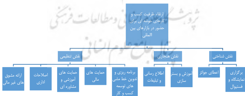
شکل ۲: مدل ارتقاء ظرفیت کسب و کارهای خوشه‌ای برای حضور در بازارهای بین‌المللی بر اساس نقش‌های دولت

بر اساس تحلیل‌های صورت گرفته بر روی داده‌های کیفی، مدل ارتقاء ظرفیت کسب و کارهای خوشه-ای برای حضور در بازارهای بین‌المللی بر اساس نقش‌های دولت شناسایی گردید. این نقش‌ها به صورت یک چارچوب مفهومی در اختیار ۱۱ تن از خبرگان (۳ نفر از اساتید دانشگاه، ۴ نفر از مدیران شهرک‌های صناعی و ۴ نفر از فعالان کسب و کارهای خوشه‌ای) قرار گرفت و از آن‌ها در خصوص تمامی دسته‌بندی‌های موجود در این چارچوب به صورت یک پرسشنامه نظرسنجی شد. پس از جمع‌آوری نظرات خبرگان و استفاده از راهنمایی‌های آن‌ها، چارچوب نهایی مورد اصلاح قرار گرفت و به صورت شکل شماره ۲ ارائه گردید.