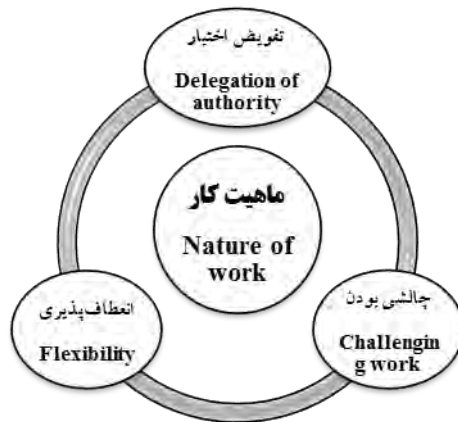
شکل ۴: مؤلفه‌های ماهیت کار