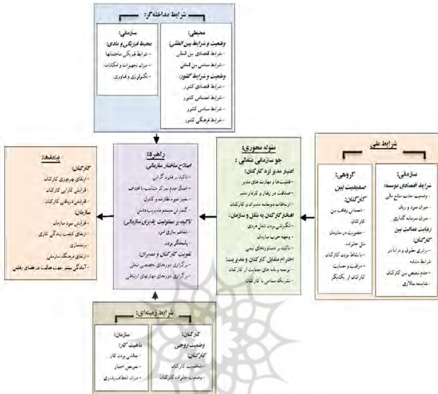
شکل ۵: الگوی پارادایمی جو سازمانی متعالی