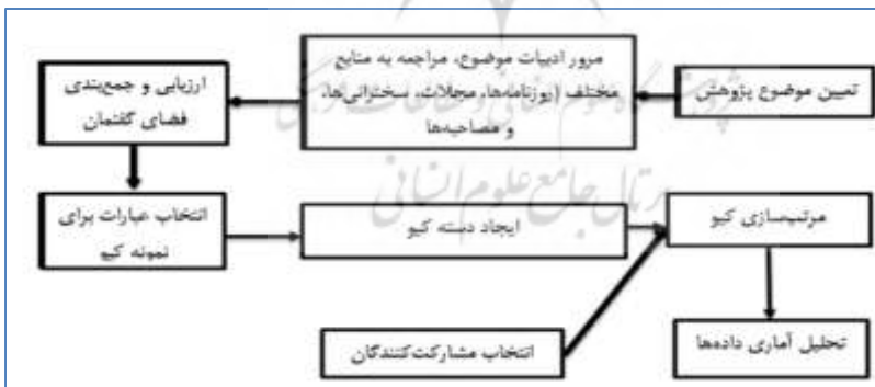
شکل ۱. مراحل روش پژوهش کیو

برخی مراحل انجام روش کیو را پنج مرحله دسته‌بندی کرده‌اند (خوشگویان‌فرد، ۱۳۸۶). در شکل ۱ مراحل انجام روش کیو آورده شده است. در این پژوهش از فرآیند پنج مرحله‌ای کیو، به شرح ۱. گردآوری فضای گفتمان ۱ (از طریق مصاحبه، مطالعه موارد مرتبط و غیره)، ۲. انتخاب نمونه معرف فضای گفتمان (با استفاده از صاحب‌نظران حوزه برند و اساتید متخصص)، ۳. انتخاب مشارکت‌کنندگان، ۴. مرتب‌سازی کیو (توسط مشارکت‌کنندگان با قرار دادن کارت‌ها در جداول کیو) بر اساس شکل (۱) و ۵. تحلیل داده‌ها (با استفاده از تحلیل عاملی) (خوشگویان‌فرد، ۱۳۸۶) استفاده شده است. تحلیل داده‌های کیفی با استفاده از روش تماتیک و در بخش کمی با استفاده از روش تحلیل عاملی و نرم‌افزار SPSS۲۵ بوده است.