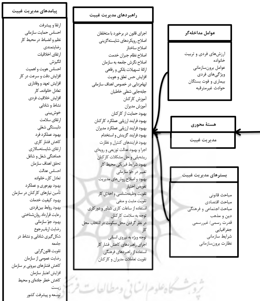
شکل ۱. مدل مدیریت غیبت از کار در اداره کل امور مالیاتی استان اصفهان (استخراجی از روش تحلیل داده)