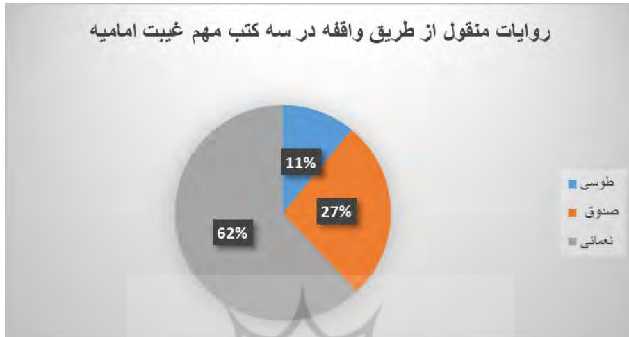
نمودار روایات منقول از طریق واقفه در سه کتب مهم غیبت امامیه

خودداری از نقل روایات از طریق واقفه داشته‌اند. بهرحال، چنان‌که در نمودار آمده است، روایات منقول از طریق واقفه، تنها ۲۱ درصد از حجم روایات غیبت را تشکیل می‌دهد.