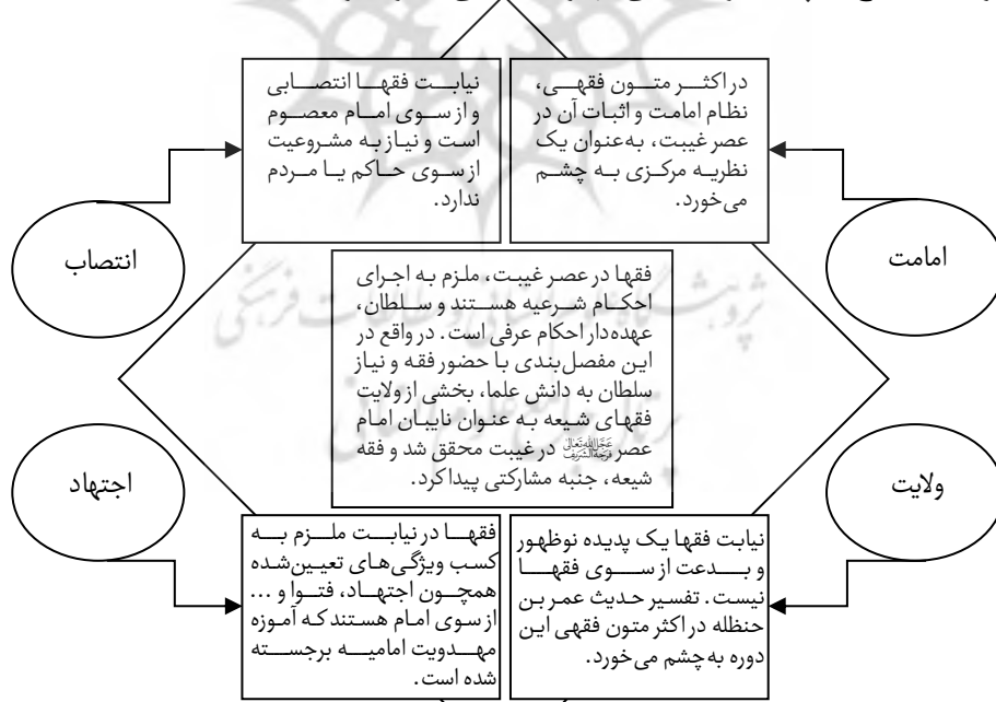
شکل (۱): نظریات فقهای شیعه در زمینه اندیشه مهدویت (اسماعیلی واحمدی، ۱۳۹۴: ۳۱)

بر این اساس، اندیشه مهدویت فقهای شیعه در راستای مقابله با هر نوعی غالی‌گری قرار گرفت که منتج به چند نظریه اساسی در فرآیند تمدنی عصر صفویه به بعد شده است: