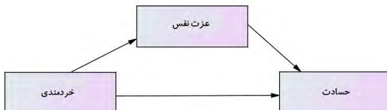
شکل ۱. مدل پیشنهادی در روابط بین خردمندی، عزت نفس و حسادت

خرد از طریق عزت نفس موجب کاهش حسادت می‌شود. مسیر این روابط را با شکل ذیل می‌توان ترسیم کرد.