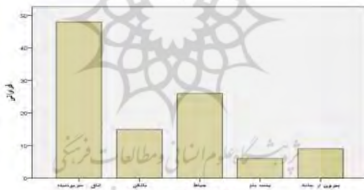
تصویر ۲. فراوانی نوع فضای انتخابی برای خلوت توسط طلاب.

خلوت می‌پذیرند. ضمن آن که ۶۹٪ نیز به رویکرد دوم نیز نظر موافق و کاملاً موافق داشته‌اند. این در حالی است که نظرات مخالف در مورد رویکرد اول، بیشتر از رویکرد دوم بود. بنابراین می‌توان رویکردی تلفیقی بین دو رویکرد فوق برای مفهوم خلوت به منظور طراحی معماری در نظر گرفت و با استفاده از عناصر کالبدی و بصری، مرزهایی برای طراحی فضای خلوت در منازل مسکونی ایجاد کرد. ضمن آن که علاوه بر سوالاتی که نشان از علاقه بیشتر طلاب برای گذران اوقات خلوت در منزل دارد، تصویر شماره ۲ نیز نشان‌دهنده کیفیت فضایی است که طلاب ترجیح می‌دهند اوقات خلوت خود را در آن بگذرانند. در تحلیل این امر، به بررسی رابطه بین سبک زندگی و وضعیت اجتماعی با فضای انتخابی برای خلوت پرداخته می‌شود. بدین منظور، ابتدا جدول توافقی برای مولفه‌ها تشکیل می‌شود و سپس برای بررسی معناداری رابطه بین فضای خلوت و وضعیت اجتماعی-معیشتی طلاب، از آزمون معناداری مربع کای استفاده می‌شود.