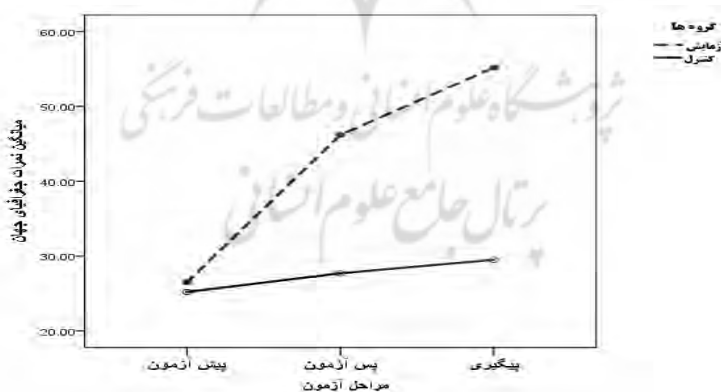
شکل ۲. نمودار مقایسه میانگین نمرات درس جغرافیای جهان گروه‌های آزمایش و گواه در سه مرحله پیش‌آزمون، پس‌آزمون و پیگیری