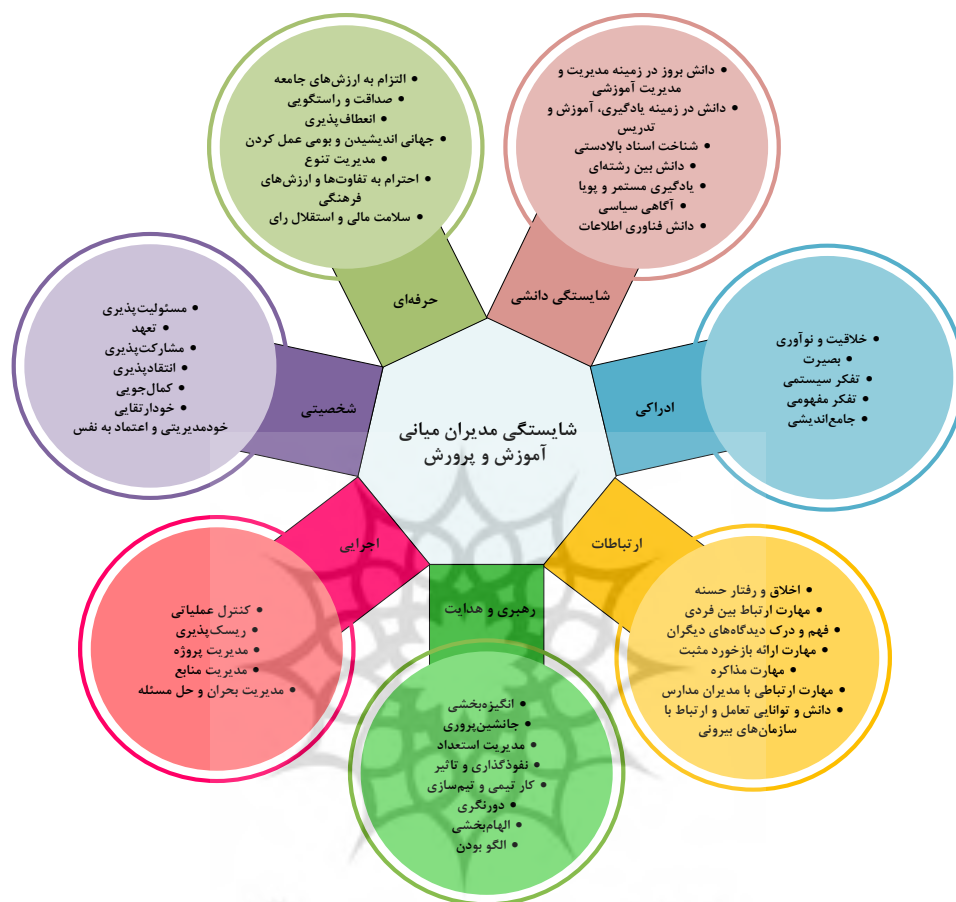
شکل ۳. نمودار گرافیکی مدل شایستگی مدیران میانی آموزش و پرورش

مدل شایستگی مدیران میانی می‌تواند در راستای انتصاب، انتخاب، ارتقا و توسعه مدیران سطح میانی آموزش و پرورش با استفاده از کانون ارزیابی و بهبود مدیریت منابع انسانی و شایسته‌سالاری در مدیریت اجرایی و ستادی آموزش و پرورش بسیار مؤثر و سودمند باشد. مدل شایستگی مدیران میانی آموزش و پرورش برای استفاده در کانون ارزیابی (مدل حاضر) با استفاده از ضوابط و چارچوب‌های کانون‌های ارزیابی در دو سطح ارائه شده است. این سطوح متشکل از ابعاد شایستگی و شاخص‌ها و نشانگرهای شایستگی است. با توجه به پیشینه پژوهش، می‌توان