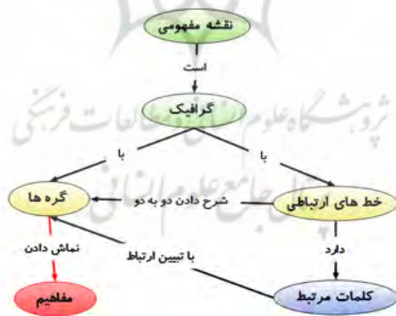
شکل ۱. تعریف نقشه مفهومی از طریق نقشه مفهومی

نقشه‌ها به دانش‌آموزان کمک می‌کنند تا یادگیری خود را تجسمی کنند. نقشه‌های مفهومی، به طور مشخص به عنوان ابزاری ساختن‌گرا شناخته شده که یادگیری فعال، انعکاسی و معنی‌دار را تسهیل می‌کند (های ۱ و همکاران، ۲۰۰۸). بسیاری از نمونه‌ها در متون کتابخانه‌ای گواهی می‌دهند سوق دادن دانش‌آموزان به تجسم کردن تحقیق، کلیدواژه‌های طوفان فکری و ایده‌های موضوع‌شان، با استفاده از ابزار نقشه‌برداری ارزشمند است (کلوسیمو ۲ و فیتزیون ۳ ، ۲۰۱۲؛ بورز ۴ ، ۲۰۱۴). نقشه مفهومی ابزاری برای نمایش اطلاعات در قالب مجموعه‌ای از نمودارها و کادرهای متصل به هم است که ارتباط منطقی بین مفاهیم به روشنی در آنها قابل مشاهده بوده و به نوعی بازنمایی تجسمی روابط معنی‌دار بین مفاهیم محسوب می‌شود. نقشه مفهومی معمولاً به شیوه حرکت از کل به جزء تنظیم می‌شود و دارای بخش‌های هسته، رابطه و گره است؛ یعنی مطالب کلی‌تر و جامع‌تر در رأس آن قرار می‌گیرد و هرچه به پایین نقشه نزدیک شویم، مفاهیم و مطالب جزئی‌تر می‌شود. در رسم نقشه‌های مفهومی، معمولاً گره‌ها داخل کادر قرار می‌گیرند و رابطه‌ها روی خطوط اتصالی نوشته می‌شوند (نواک ۵ و کوئین ۶ ، ۱۹۸۴). نقشه مفهومی ابزاری برای وصف ایده‌ها و مفاهیم کلیدی مربوط به یک موضوع در قالب یک شکل ترسیمی است (گال و بومن ۶ ، ۲۰۰۶).