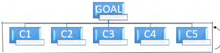
شکل ۱- مدل مفهومی پژوهش (ANP)