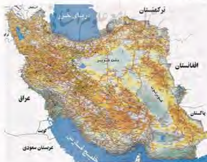
نقشه 1-1 کشور ایران