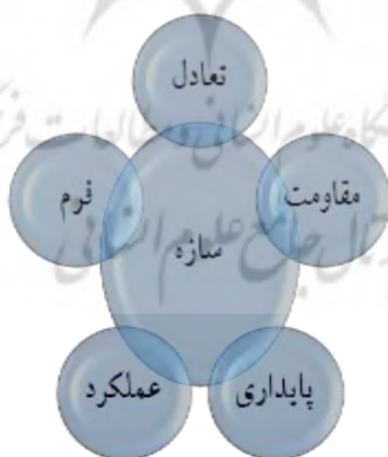
نمودار (۱): عوامل مؤثر بر ساختار سازه

ه) فرم: سازه به عنوان یکی از اجزای طراحی، نقش اصلی را در پدید آوردن فرم دارد. فرم سازه‌ای، خلق زیبایی از طریق تراش و اندازه مناسب، به منظور تسهیل جریان نیرو در یک نظام سازه‌ای است که از اهمیت ویژه‌ای برخوردار است.