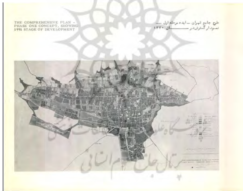
نقشه ۱. طرح جامع تهران، ایده مرحله اول