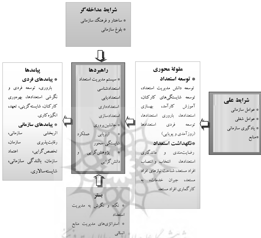
شکل ۲) مدل کدگذاری محوری بر اساس الگوی پارادایم مدیریت استعداد با تأکید بر توسعه و نگهداشت استعداد