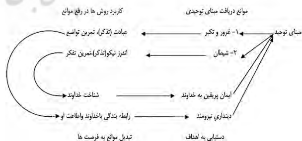
شکل ۱: رابطه مبنای، روش‌ها و اهداف با موانع و فرصت‌های تربیتی (منبع، مولفان)

نکته دیگری که با نگاه هم‌زمان به جدول یک و دو حاصل می‌شود این است که همه اجزای نظام تعلیم و تربیت با یکدیگر مرتبط و درهم‌تنیده‌اند. می‌توان این درهم‌تنیدگی و ارتباط را در قالب مثال زیر آشکار نمود: