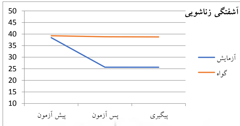
نمودار شماره ۱. مقایسه آشفتگی زناشویی در سه زمان در دو گروه آزمایش و گواه

بر اساس نتایج جدول (۶) آزمون تعقیبی LSD، ملاحظه شد بین پیش آزمون، پس آزمون و پیگیری، میانگین نمره آشفتگی زناشویی اختلاف معنی داری بین گروه‌های آزمایش و گواه وجود دارد ( p < 0.05 ) البته با توجه به فاصله اطمینان ۹۵ درصد نتایج نشان داد آشفتگی زناشویی در گروه آزمایش نسبت به گروه گواه کاهش معنی داری (حد بالا و پایین هر دو منفی) وجود دارد. بنابراین در زمان‌های